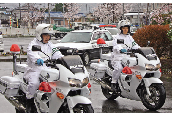
白バイ隊を先導に交通安全パレード出発の様子

蔵の街交通安全パレードでは、交通安全啓発のため真壁の町並みから県道・国道でパレードを行い、最後に雨引山薬法寺で悲惨な交通事故が起こらないよう交通安全祈願をしました。皆様の交通ルールの遵守と交通マナーの向上をお願いします。