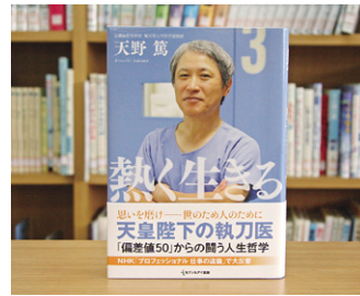
熱く生きる 天皇陛下の執刀医 天野 篤 著

貸出期間 ▼ 2週間 (1人5冊まで) 開放時間 ▼ 9時~17時 休日 ▼ 月曜日・祝日 問合せ ▼ ☎ 029615817117