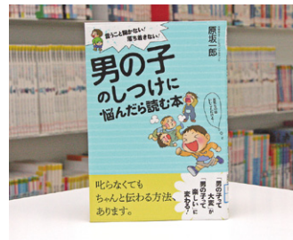
男の子のしつけに 悩んだら読む本 原坂 一郎 著

貸出期間 ▼ 2週間 (資料合計: 1人10冊まで) 開放時間 ▼ 平日10時~18時 土・日曜日9時~17時 休日 ▼ 月曜日・祝日 問合せ ▼ ☎ 029612318525