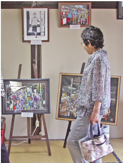
伊勢屋旅館の切り絵展。2階の広間に56点の作品が飾られました。切り絵展は新聞にも取り上げられ、500人を超える見学者が訪れました。4月29日と5月6日は、切り絵の体験教室も開かれました。

今年のゴールデンウィーク、真壁地区では真壁八七咲き社中と桜川本物づくり委員会の皆さんを中心に、真壁に來られた方に楽しんでもらうと、建物を開放し色々な展示などが行われました。