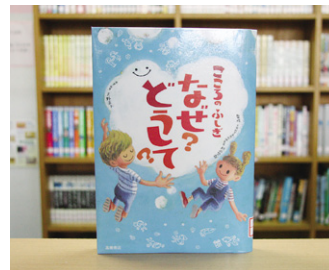
こころのふしぎ なぜ？どうして？ 村山 哲哉 監修

貸出期間 ▼ 2週間 (1人5冊まで) 開放時間 ▼ 9時~17時 休日 ▼ 月曜日・祝日 問合せ ▼ ☎ 029617510344