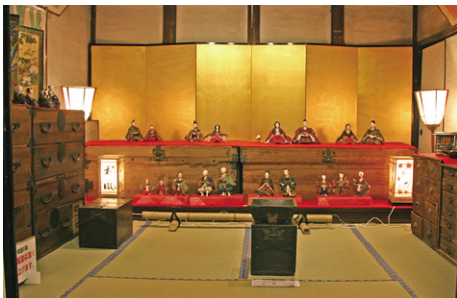
川島書店見世蔵のひな飾り。ひなまつり期間中は公開されていない2階に、お雛様が飾られました。

ぎ、町並みの修復も進んできました。そして、修復に合わせ、有志の皆さんによる年間を通したおもてなしのまちづくりが進み始めました。自主的に活動する人が多くなればなるほど、まちは元気になります。いつ訪れても楽しめるまちへ、新たなまちづくりが動き出しました。