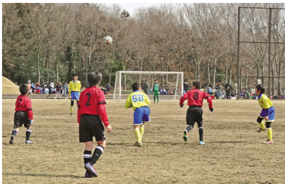
強風の中、激戦が繰り広げられたスミハツカップ

また、今年を通算20回目の開催を記念して、同社から参加した各チームへサッカーボールが贈られました。