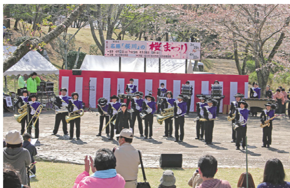
桜まつりのオープニングを飾った岩瀬西中学校のマーチングバンド

期間中の4月12日には、同公園でイベントが開催され、桜が満開に咲く中で、市民団体による芸能発表や野点、稚児行列などが行なわれ、まつりを盛り上げました。