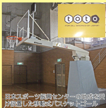
日本スポーツ振興センターの助成金を受け設置した移動式バスケットゴール

岩瀬体育館「ラスカ」に新しい移動式バスケットゴールを設置しました。これは、既存の移動式バスケットゴールの老朽化に伴い日本スポーツ振興センターのスポーツ振興くじ（toto）助成金を利用して設置したものです。