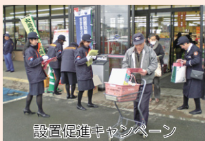
設置促進キャンペーン

■問合せ先／桜川市生活安全課（☎58-5111・75-3111代表）、桜川消防署（☎0296-75-3592）