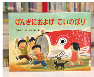
げんきにおよげ こいのぼり 今関信子 作/福田岩緒 絵

貸出期間 ▼ 2週間(資料合計:1人10冊まで) 開放時間 ▼ 平日10時~18時、土・日曜日9時~17時 休館日 ▼ 月曜日・祝日 問合せ ▼ ☎ 029612318525