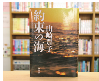
約束の海 山崎 豊子 著

貸出期間 ▼ 2週間(1人5冊まで) 開放時間 ▼ 9時~17時 休館日 ▼ 月曜日・祝日 問合せ ▼ ☎ 029617510344