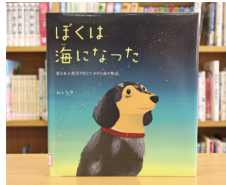
ぼくは海になった 東日本大震災で消えた小さな命の物語 うさ 作/絵

貸出期間 ▼ 2週間(1人5冊まで) 開放時間 ▼ 9時~17時 休館日 ▼ 月曜日・祝日 問合せ ▼ ☎ 029615817117