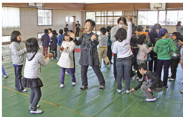
一緒に竹トロンボを飛ばす羽黒小児童と学校支援ボランティア会員