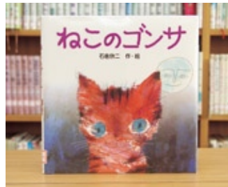
ねこのゴンサ 石倉 欣二 作・絵

貸出期間▼2週間(1人5冊まで) 開放時間▼9時~17時 休館日▼月曜日・祝日 問合せ先▼02965817117