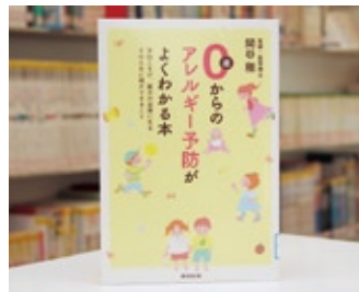
0歳からのアレルギー予防がよくわかる本 関谷 剛 著

貸出期間▼2週間(資料合計:1人10冊まで) 開放時間▼平日10時~18時 土・日曜日9時~17時 休館日▼月曜日・祝日 問合せ先▼0296238525