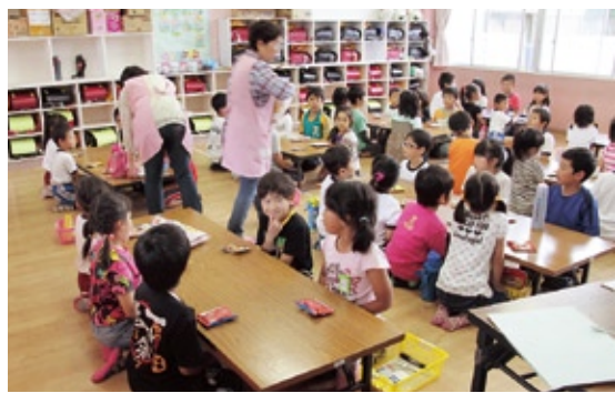
子育て支援のため、「放課後児童対策事業」として、市内全学区で開設している学童保育クラブ。家庭と同じような環境で、放課後の時間を安全に過ごすことができます。