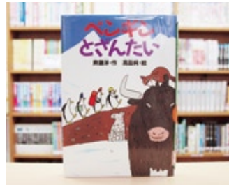
ペンギンとざんたい 斉藤 洋 作/高島 純 絵

貸出期間▼2週間(1人5冊まで) 開放時間▼9時~17時 休館日▼月曜日・祝日 問合せ先▼02967510344