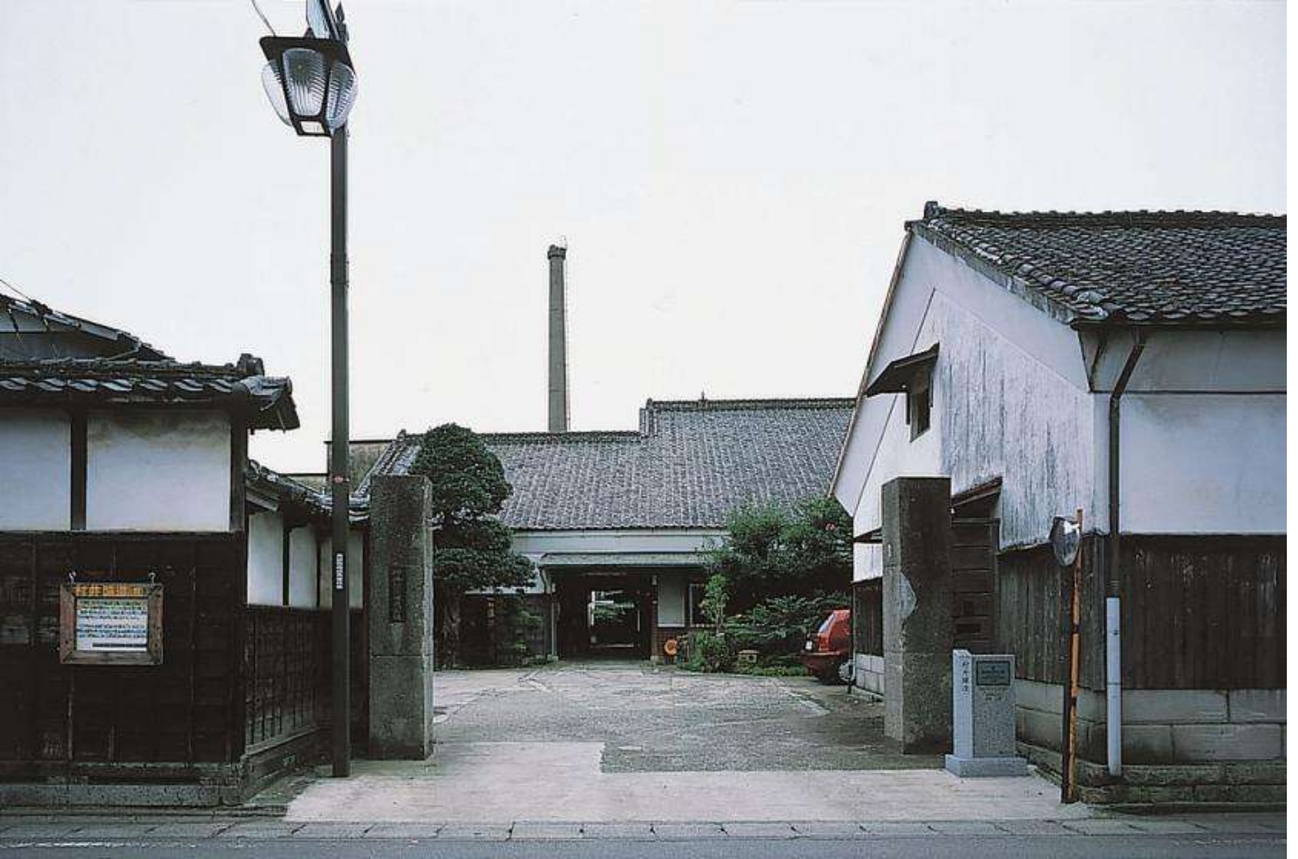
明治・大正時代建設の建造物が建ち並ぶ酒造場(下宿通り・村井醸造)