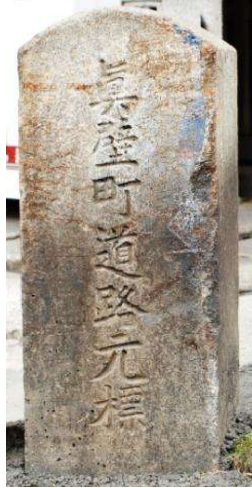
鍵の手の交差点に設置された道路元標 (御陣屋前通り・下宿町通り)