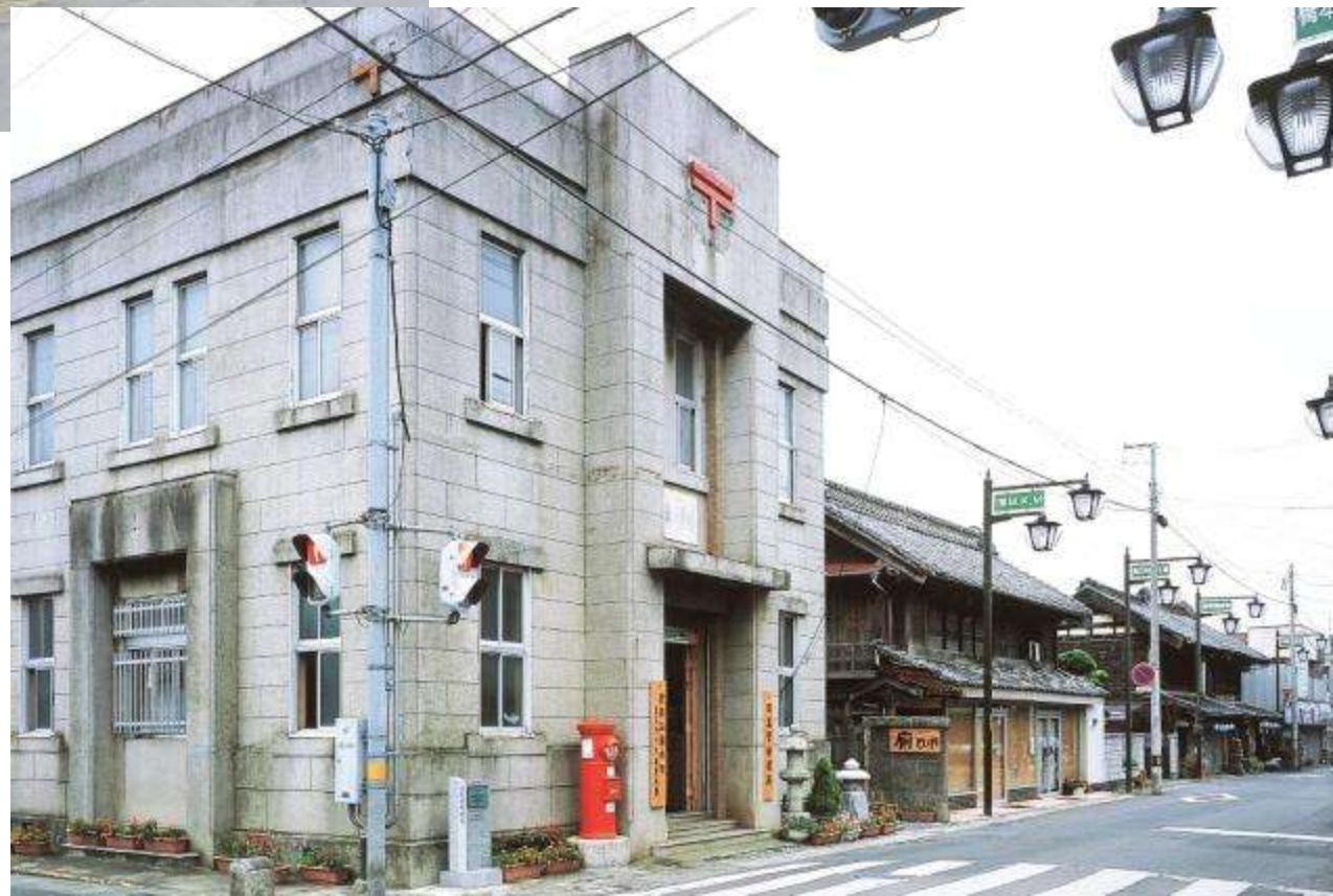
御陣屋前通り北部の景観