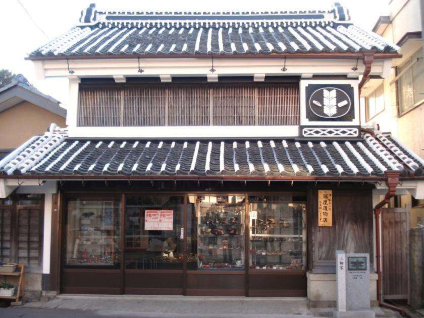
明治末期建設の見世蔵(高上町通り・三輪家)