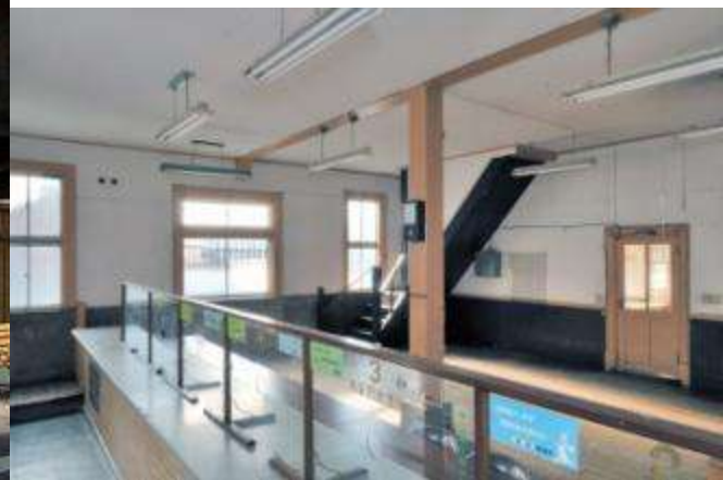
昭和初期建設の洋風建築(御陣屋前通り・旧眞壁郵便局)