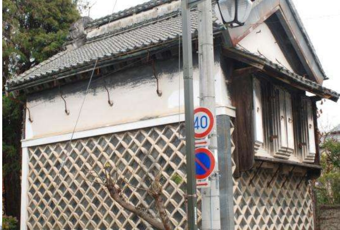
重厚な海鼠壁を持つ土蔵 (高上町通り・土谷家)