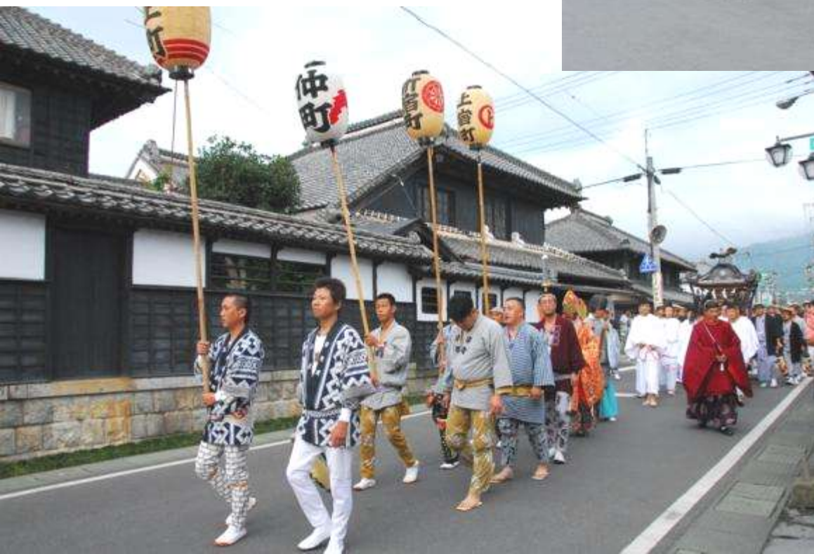
下宿町通り中部の景観