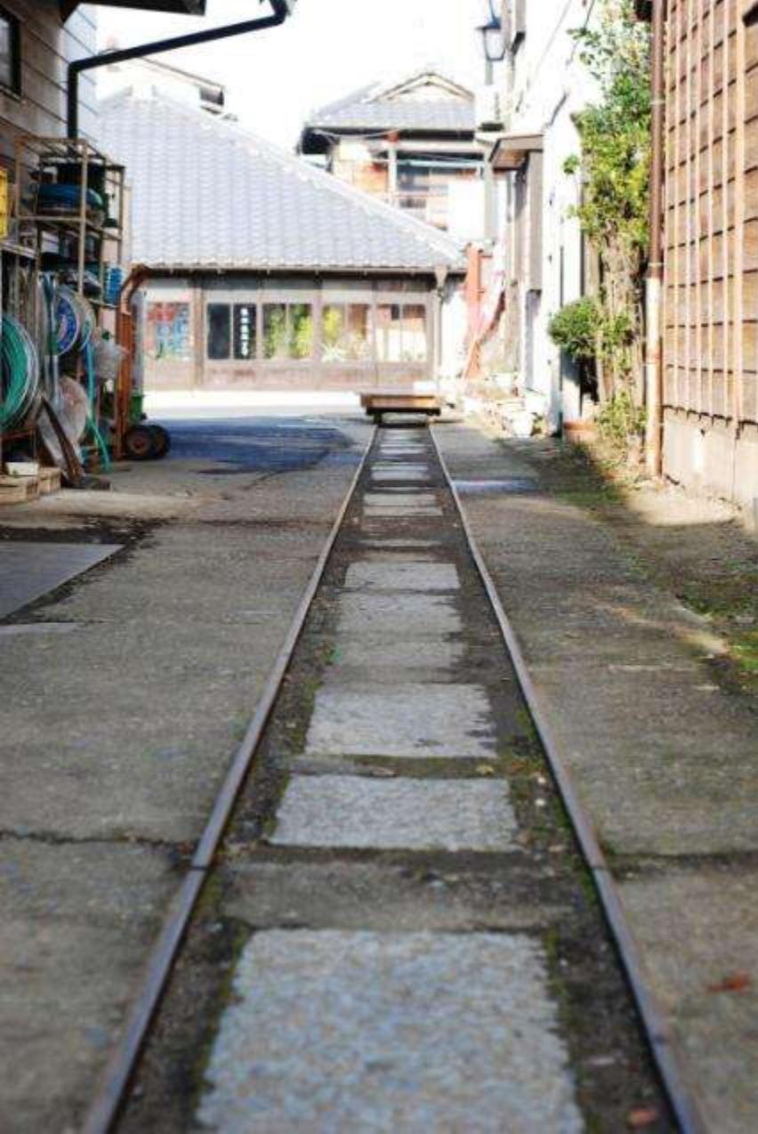
重い金物や石材を運搬する軌道 (下宿町通り・石田金物店)