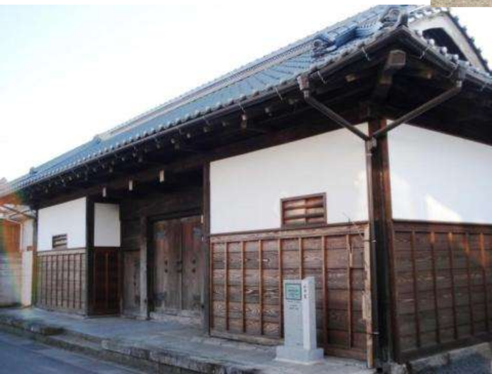
通りに面して建つ長屋門 (仲町通り・山中家)