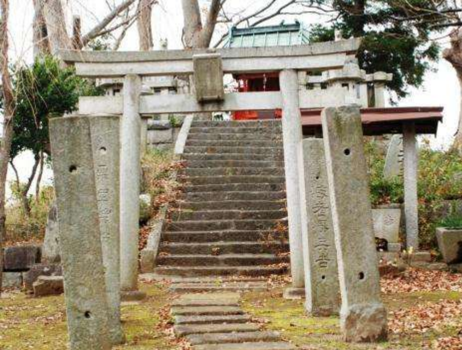
参道を彩る石造物群(下宿町・口明塚稲荷)