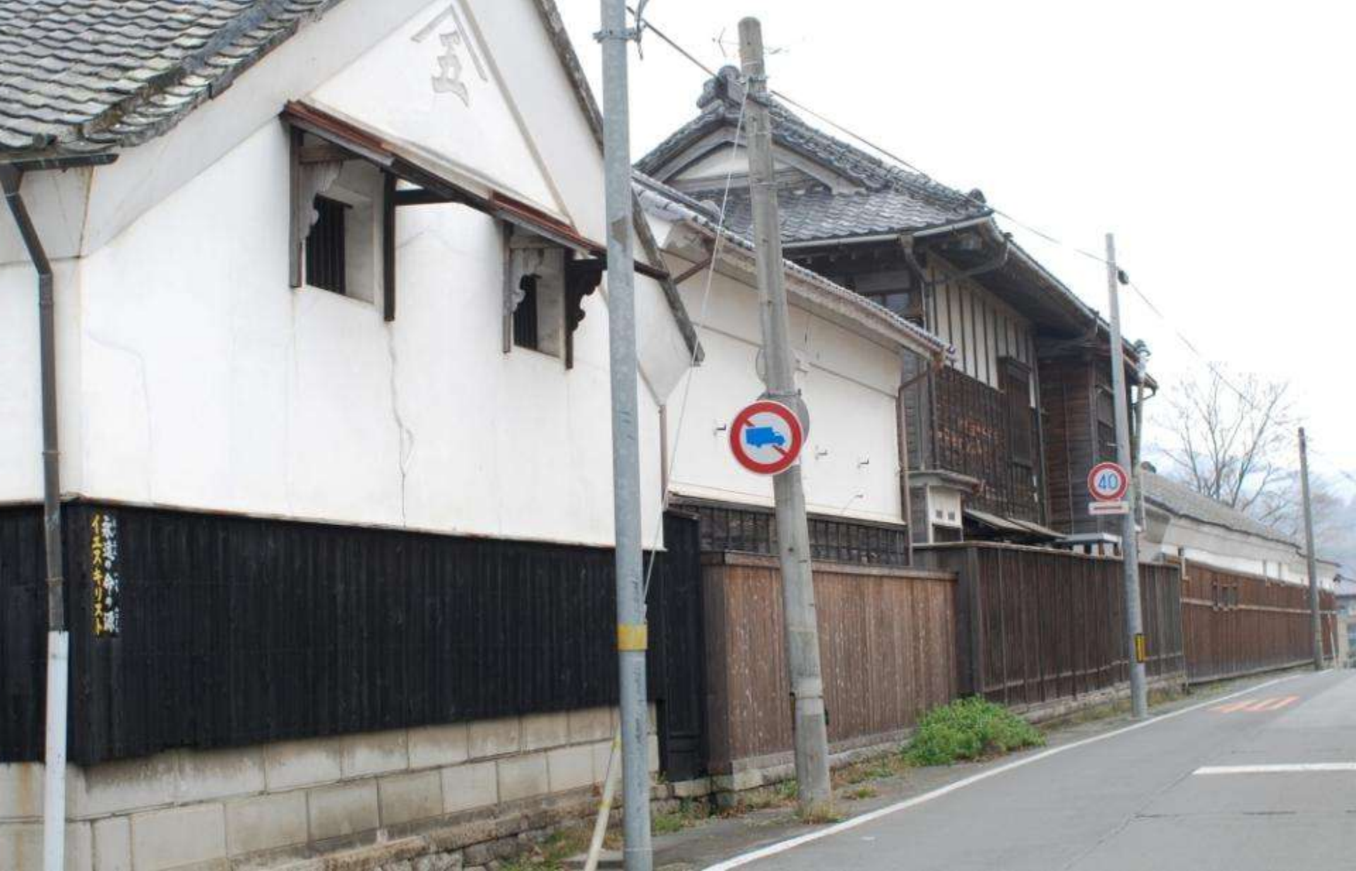
下宿町下がり地区の景観