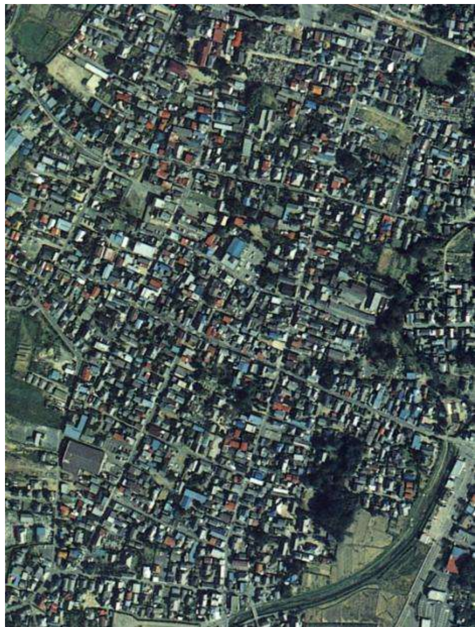
平成10年(国土地理院撮影)