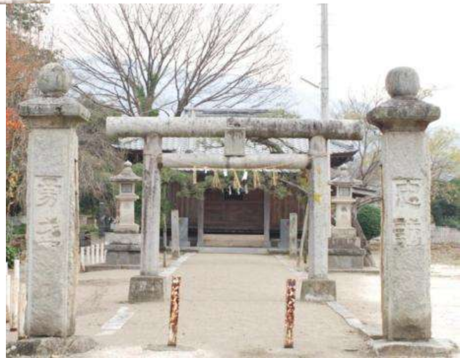
参道に並ぶ真壁石製の石造物 (大和町・神武天皇遙拝所)