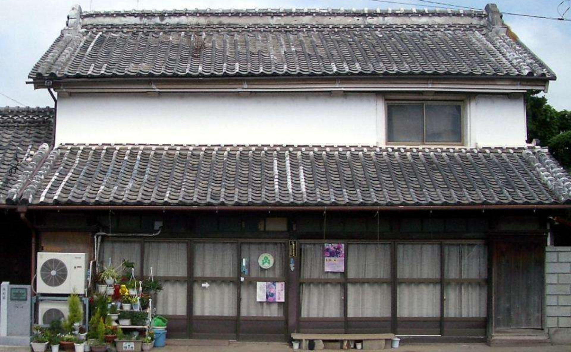
天保年間建設の見世蔵(御陣屋前通り・木村家)