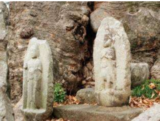
古木に寄り添う石仏