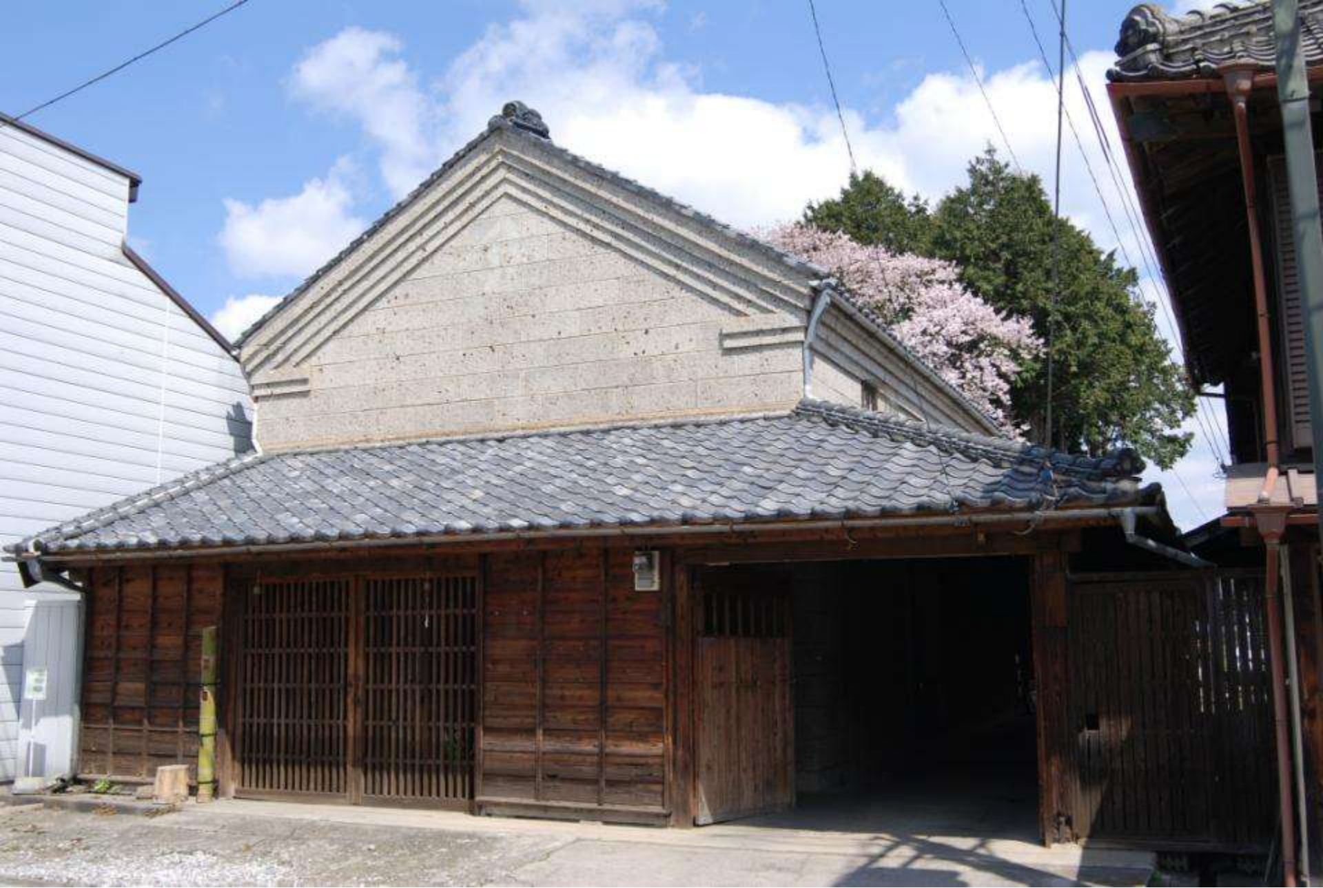
大正時代建設の石蔵(下宿通り・村井醸造旧米蔵)