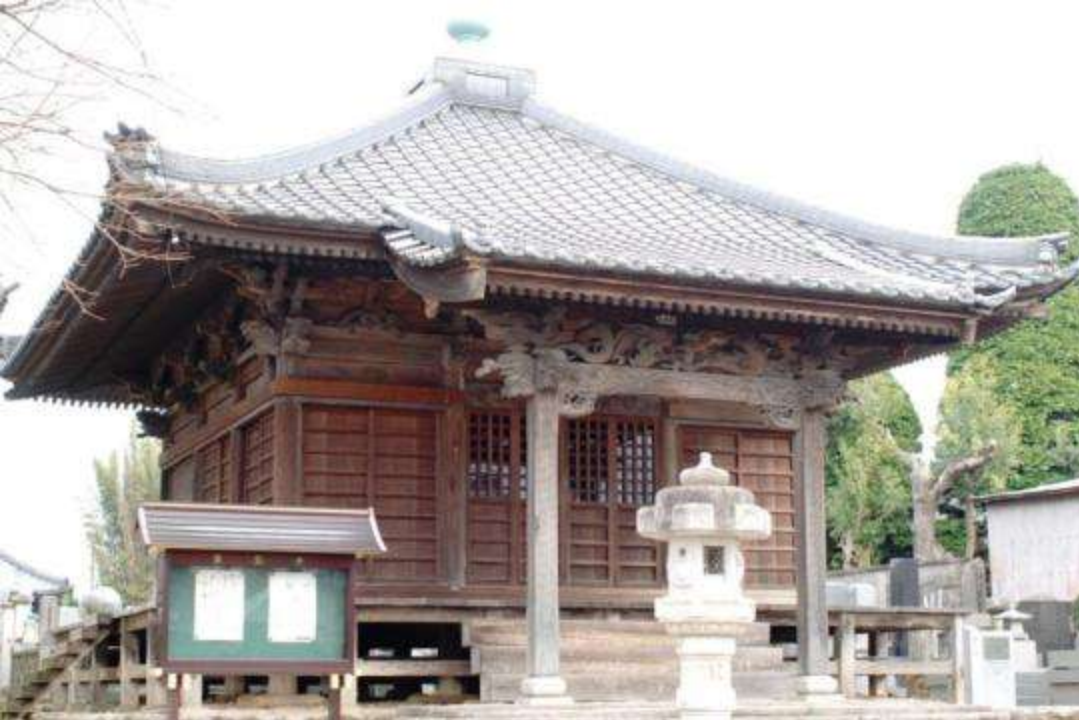
方位十二支の彫刻を備えた不動堂 (天保11年・下宿町通り・密弘寺)