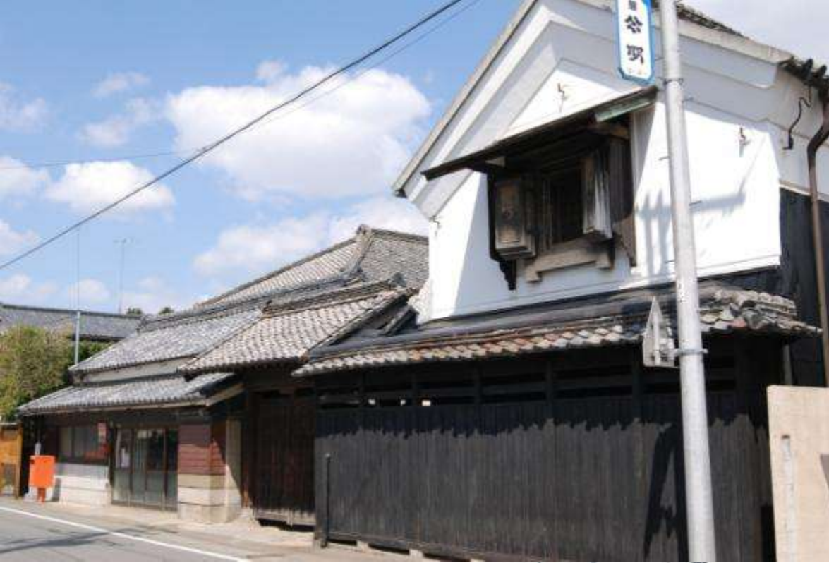
上宿町通りの景観