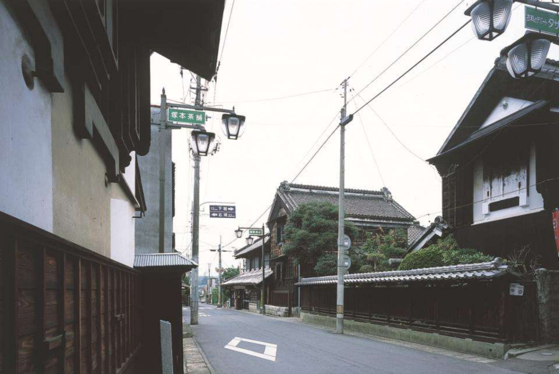
御陣屋前通り南部の景観