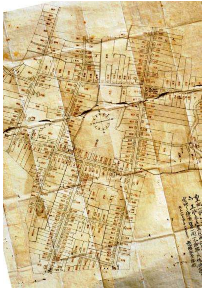
明治時代(「町屋村地租改正図」)