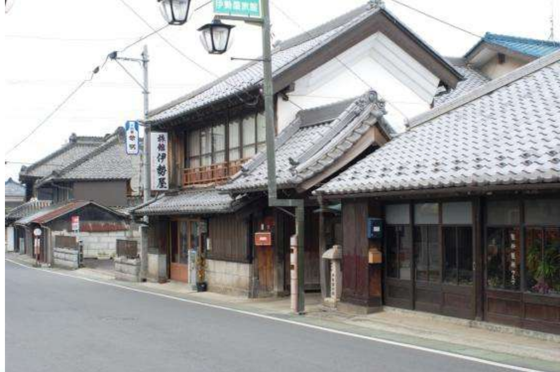
下宿町通り東部の景観