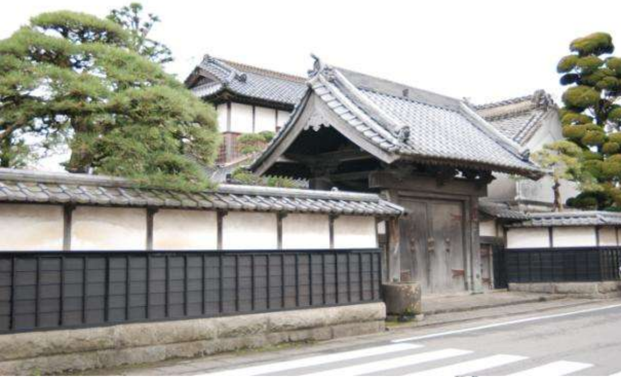
主屋の脇に接続する薬医門 (下宿通り・伊勢屋旅館)