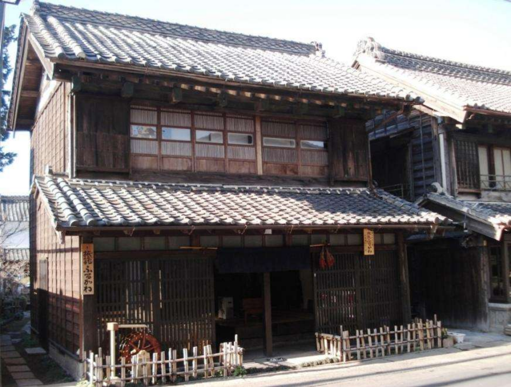
大正時代建設の真壁造の町家(御陣屋前通り・旅籠ふるかわ)