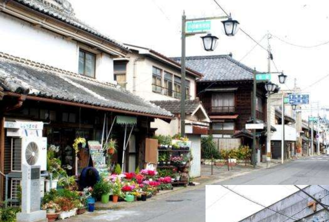
御陣屋前通り中部の景観