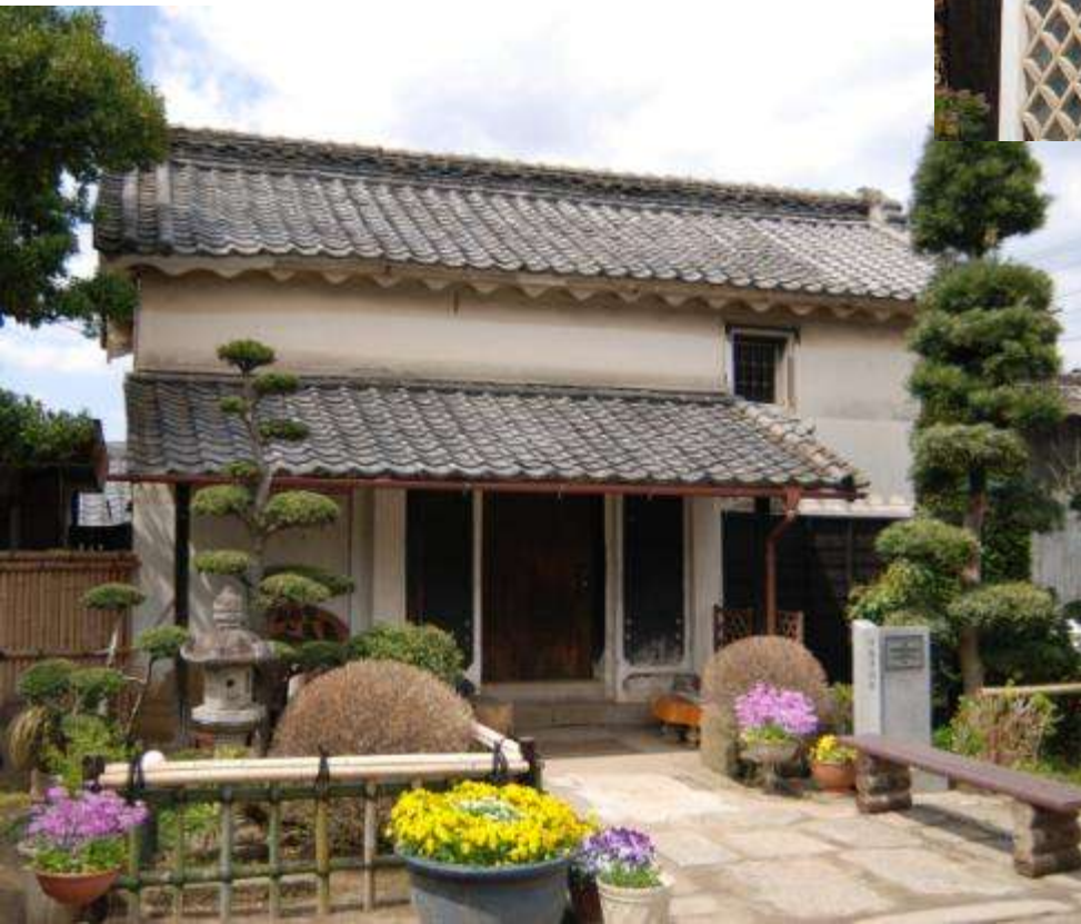
敷地の奥に配置される土蔵 (御陣屋前通り・川島家)