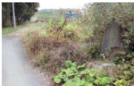
江戸時代に置かれた鎌倉街道の道標(追分石)。「右あふき(あおき) 左あまびき、つくば」とあります。