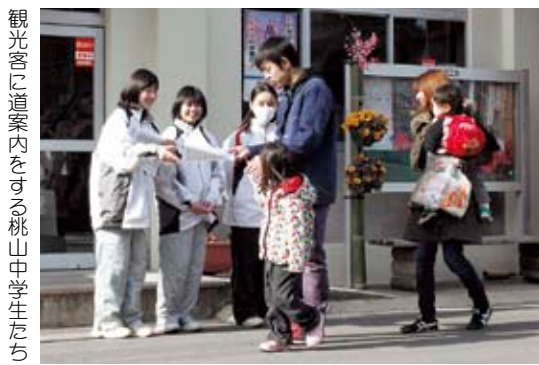
観光客に道案内をする桃山中学生たち

「自分たちのできることでまちをよくしたい」このような思いを持つ人が増えれば、まちは元気になります。みんなの力で元気な桜川市をつくっていきましょう。