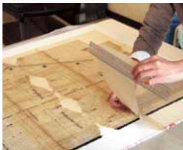
慎重に裏打紙を貼る