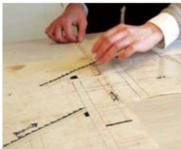
古文書を貼り合わせる

写真の古文書は6枚の紙を 貼り合わせた大判の図面 です。この6枚を貼り直すこ とから始めます。まず、図面 上の線・文字の切れ目から元 の重なり方を確認し、でんぷ 糊で丁寧にゆきま