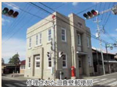
修理された旧真壁郵便局