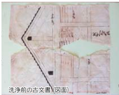
洗浄前の古文書(図面)

これから先も大切に保管するため、どのような修復を行うべきなのか。この先の工程については、また次回、説明します。