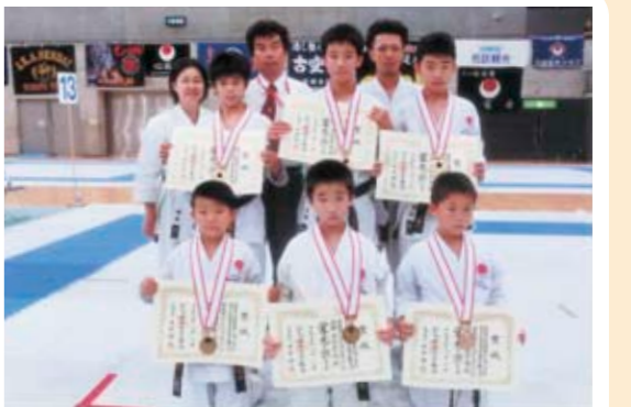
空手の全国大会で優秀な成績を収めた大和道場の選手の数々