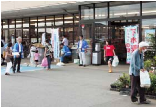
下水道接続促進キャンペーンでは、今年もゆるキャラのいしおさんがPRに役買いました。

これは、全国下水道促進デーとして始まった「下水道の日」の活動の一環として行われたものです。当日は、買い物客の皆さんへ、リーフレットや啓発品を配布し、公共下水道や農業集落排水への早期接続の呼びかけを実施しました。大切な水資源を次世代に継承するためにも早期接続にご理解とご協力をお願いいたします。