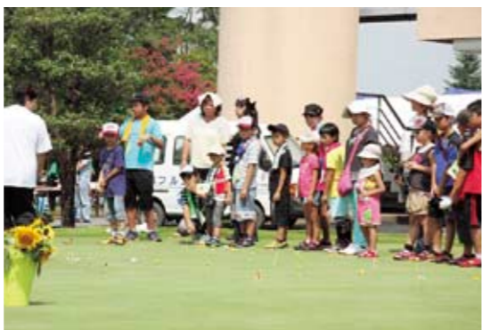
無料開放されたゴルフ場の芝生の上で、バターゴルフを楽しむ子どもたち

当日は、約650人が参加し、バターゴルフやわなげ、サッカーボールドラゴンなどのイベントを楽しみました。