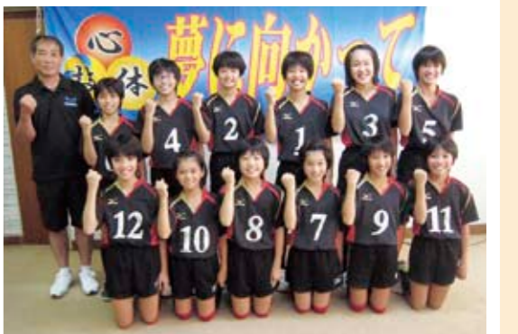
茨城県代表として関東大会へ出場した羽黒バレーボールスポーツ少年団の数々