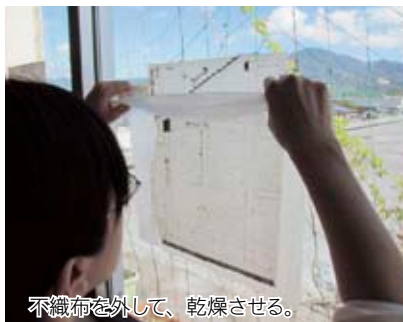
不織布を外して、乾燥させる。