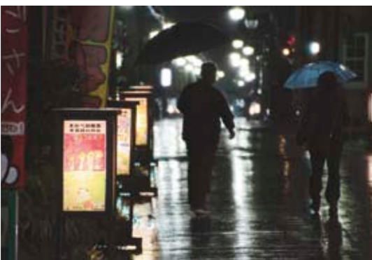
「蔵の街行灯まつり」で、店先などに並ぶ行灯

これは、茨城県商店街活性化コンペ事業の一環として、行灯を利用して趣のある癒されるまちづくりを行い、来訪者を増やそうとしたものです。当日は雨にもかかわらず、約250人が来訪し、店先に並んだ真壁幼稚園児たちの絵が入った行灯や真壁伝承館で行われたダンスや演舞などを楽しみました。同商店会では、歴史ある町並みのシンボルの一つとして、今後も行灯を活用したまちおこしを行っていくそうです。