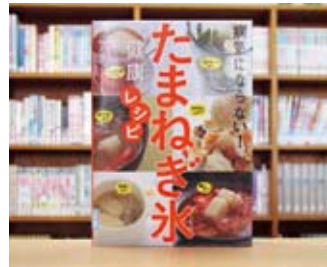
病気になるない! たまねぎ氷 健康レシピ 村上 祥子 著

貸出期間▼2週間(1人5冊まで) 開放時間▼9時~17時 休館日▼月曜日・祝日 問合せ先▼0296750344