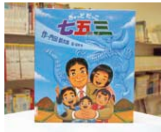
ぎゅっとだっこ 七五三 山本 孝 絵/内田麟太郎 作

貸出期間▼2週間(資料合計:1人10冊まで) 開放時間▼平日10時~18時 土・日曜日9時~17時 休館日▼月曜日・祝日 問合せ先▼0296238525