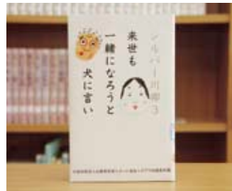
シルバー川柳 3 坂井 宏先 編

貸出期間▼2週間(1人5冊まで) 開放時間▼9時~17時 休館日▼月曜日・祝日 問合せ先▼0296587117