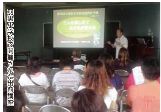
羽黒小学校で開催された出前講座

す。そして、愛されているという実感が子どもの成長に大きな影響を与えます。反対に、子どもを責めたり、親の考えを押し付けたりすると、子どもの成長をゆがめてしまう場合があります。