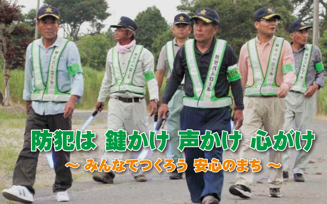
地区内の防犯パトロールを行う防犯連絡員の皆さん(真壁町椎尾地区)