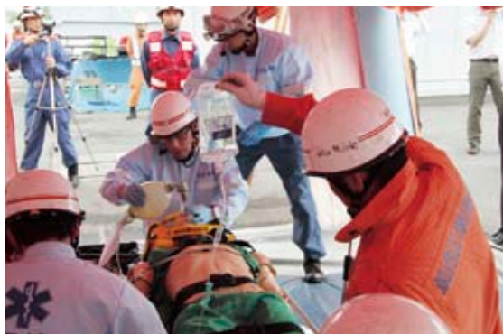
ビル倒壊を想定した墜落外傷でショック状態の傷病者を救急処置する隊員たち

この訓練は、複雑多様化する災害に対処し、筑西広域圏内の救助体制と救急体制の連携向上を図ることを目的として実施されたものです。筑西レスキュー隊による訓練では、ビル倒壊を想定したロープブリッジ救出、障害突破、引揚救助訓練をするなど、隊員同士声を掛け合いながら日ごろの訓練の成果を披露しました。