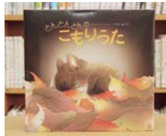
とんとんとんのこもりうた いもと ようこ 作・絵

貸出期間▼2週間(1人5冊まで) 開放時間▼9時~17時 休館日▼月曜日・祝日 問合せ先▼02965817117