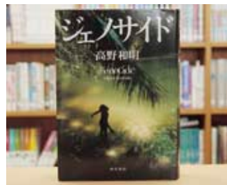
ジェノサイド 高野 和明 著

貸出期間▼2週間(1人5冊まで) 開放時間▼9時~17時 休館日▼月曜日・祝日 問合せ先▼02967510344