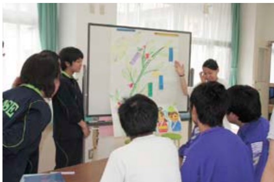
高齢者が楽しめるレクリエーションを発表する岩瀬高校生の皆さん

これは、両校の交流および共同学習として2年前から毎年実施しています。今回は、両校で勉強している高齢者が楽しめるレクリエーションをお互いに発表し合いました。また、岩瀬高校生が手伝って協和特別支援学校生に妊婦体験してもらいました。交流会を終えた岩瀬高校生たちは、「レクリエーションの良い点や改善点が分かりました」「お互いに楽しめた交流会になりました」などと感想を話していました。