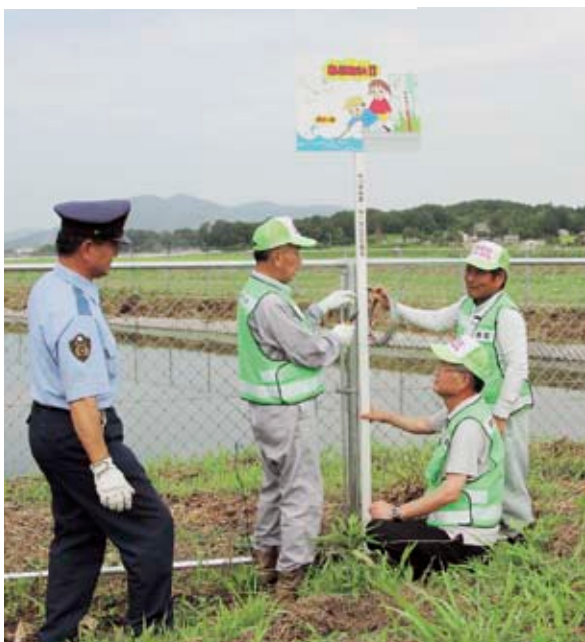
警察官立会いの下、夏休みを前に「水遊び注意」の看板をため池に設置する防犯ボランティアの皆さん(池亀地区)