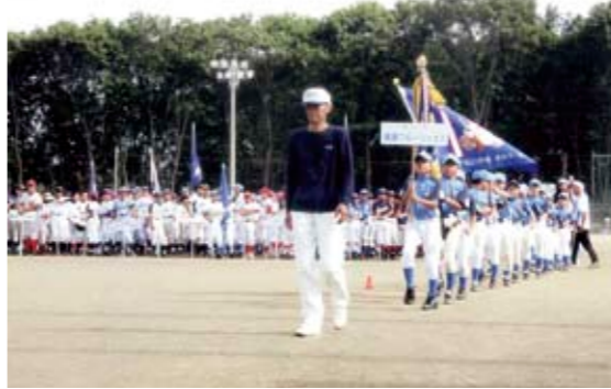
開会式で入場行進を行う樺穂ブルーージェイズの選手たち

本大会は、本市の樺穂ブルーージェイズ主催で、野球スポーツ少年団の友好と親睦、競技力のレベルアップを図ることを目的に毎年1回開催されているもので、同チームと交流のある市内や近隣地域から31チームが参加。厳しい練習を重ねてきた子どもたちは、梅雨明け直後の猛暑にも負けず、元気がいっぱいプレーしました。結果、筑西市の下館ホワイトイーグルスが熱戦を勝ち抜き、見事初優勝を果たしました。