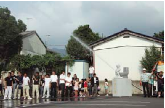
記録にチャレンジする小便小僧と観客の皆さん

いたくましい像に出来上がりしました。これまでの記録は、3.9m。今回のチャレンジでは、これを大きく超える29.3mを記録し、新記録を達成しました。