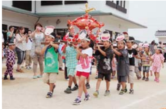
元気にお神輿を担ぐ児童たち

児童たちは、アニメ「ちびまるこちゃん」のキャラクターのお面を頭につけ、ちびまるこ音頭を踊ったり、「わっしょい！」と元気なかけ声とともにお神輿を担いだりして、来場者を楽しませました。