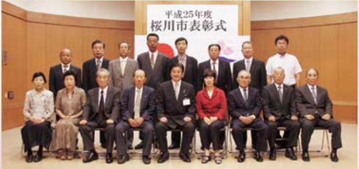
「桜川市表彰式」に出席された皆さん

表彰された方々は次のとおりです。なお、事績の概要は平成25年4月1日現在です。(順不同・敬称略)