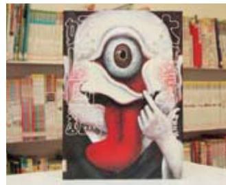
大接近! 妖怪図鑑 軽部 武宏 作

貸出期間▼2週間(資料合計:1人10冊まで) 開放時間▼平日10時~18時 土・日曜日9時~17時 休館日▼月曜日・祝日 問合せ先▼02962318525