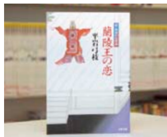
蘭陵王の恋 新・御宿かわせみ 平岩 弓枝 著

貸出期間▼2週間(資料合計:1人10冊まで) 開放時間▼平日10時~18時 土・日曜日9時~17時 休館日▼月曜日・祝日 問合せ先▼0296238525