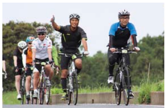
交通ルールを守り楽しく走る選手たち

「ツール・ド・さくらがわ」開催 5月19日、桜川市周辺をコースにしたサイクリングイベント「2013ツール・ド・さくらがわ」が開催されました。 このイベントは、交通ルールを守り、自分のペースで完走を目指すもので、上曽峠や稜線林道などの山間部を含むコースを走破する約100kmコース。平坦な自然の中を走る約90kmコース。市内などをガイド付きで散策するポタリングコースが設けられました。 当日は、市内外から約600人が参加。桜川市周辺の美しい自然環境や伝統的な町並みを始めとする歴史的景観のなかをサイクリングしました。