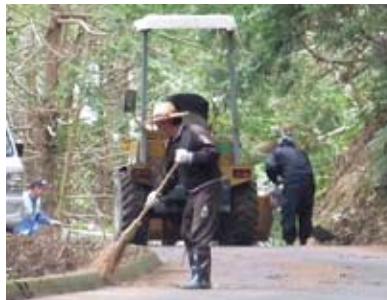
林道などを清掃する「龍神山の山桜を愛する会」の皆さん

また、山桜開花前には、地元の方々を中心につくられた「龍神山の山桜を愛する会」の皆さんが、林道の落葉や側溝にたまった泥の清掃などを行ってきました。つついとききれいな山桜ばかりが目がいってしまいますが、その後ろではたくさんの人たちがさまざまな活動を行っています。そのような皆さんの努力が美しい山桜の里をつくりあげています。