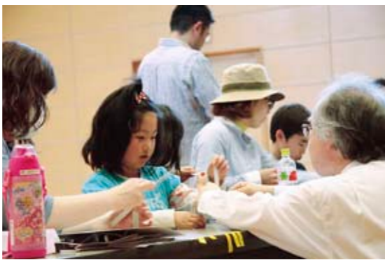
紙飛行機の折り方について説明を受ける参加者

「家庭の日」前日の5月18日に、大和ふれあいセンター「ジトラス」で、「親子で学ぶ理科実験教室」が開催されました。 「家庭の日」は、「ゆつくりと家族で語らいやふれあいをしよう」という日です。 この教室には、親子12組32人が参加し、紙飛行機、べつ甲飴、水ロケットなど手作りして楽しめる実験をしました。 普段、子どもたちと接する機会の少ないお父さんも、理科の不思議について学びながら、童心にかえり、親子で楽しい時間を過ごしました。