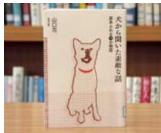
犬から聞いた素敵な話 (涙あふれる14の物語) 山口 花 著

貸出期間▼2週間(1人5冊まで) 開放時間▼9時~17時 休館日▼月曜日・祝日 問合せ先▼02965817117