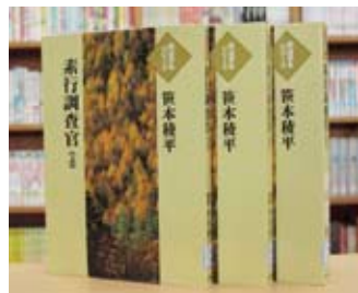
大活字本 素行調査官 上・中・下 笹本 稜平 著

貸出期間▼2週間(1人5冊まで) 開放時間▼9時~17時 休館日▼月曜日・祝日 問合せ先▼02967510344