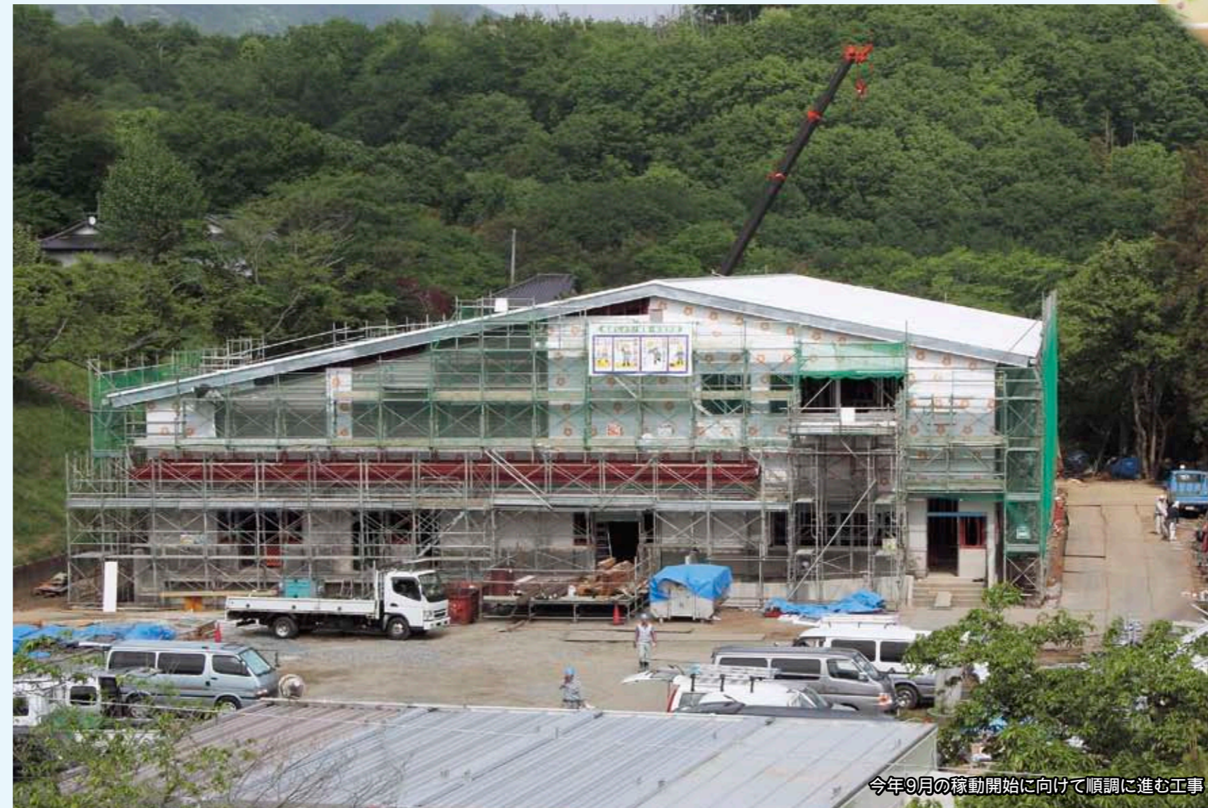
今年9月の稼働開始に向けて順調に進む工事