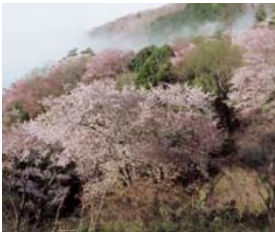
平沢地区北側にある高峯の山桜

平沢地区から高峯へと向かう林道沿いには、美しい山桜の風景が広がっています。高峯周辺では、数年前から地元の方々が「桜川日本花の会」の皆さんが山の下刈りや枝払いなどを行い、山桜の景観づくりに取り組んできました。