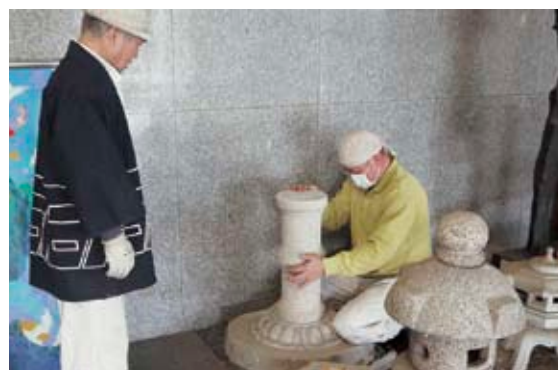
真壁庁舎で、春日燈籠を修復する伝統工芸士の皆さん

今回、真壁石材協同組合のメンバーが、その春日燈籠が破損したままの状態であることに気付き、「真壁石燈籠」の技術・技法を継承する伝統工芸士の皆さんが、修復してくださいました。