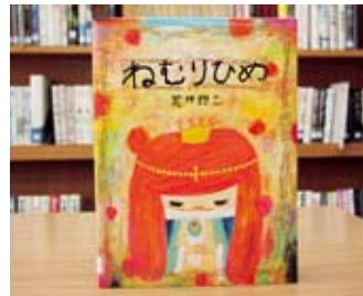
ねむりひめ 荒井 良二 著

貸出期間▼2週間(1人5冊まで) 開放時間▼9時~17時 休館日▼月曜日・祝日 問合先▼0296-58-7117