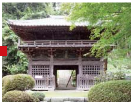
修理前の寄棟、瓦葺で背の低い仁王門