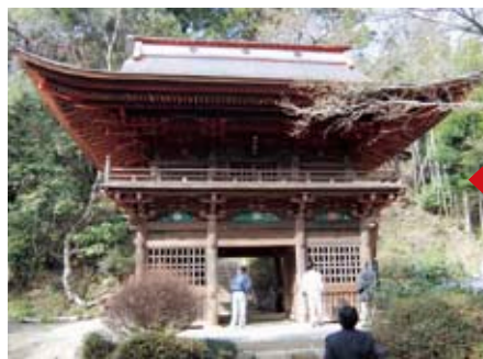
2階の高さを戻し入母屋造の屋根で復元