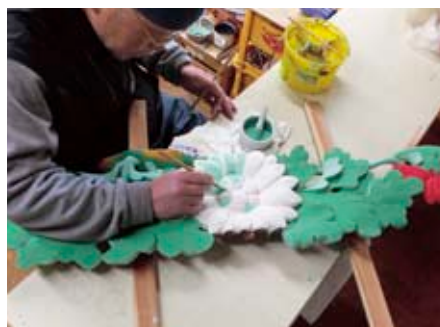
飾り彫刻を修理している様子