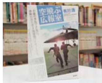
空飛ぶ広報室 有川 浩 著

貸出期間▼2週間(資料合計...1人10冊まで) 開放時間▼平日10時~18時 土・日曜日9時~17時 休館日▼月曜日・祝日 問合先▼0296-23-8525