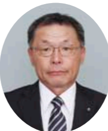
①真壁町下谷貝1116 ②茨城県西農業共済組合推薦 ③担当地区/上谷貝北部・南部、東矢貝、大塚新田