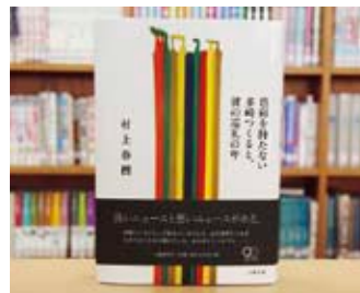
色彩を持たない多崎つくると、彼の巡礼の年 村上 春樹 著

貸出期間▼2週間(1人5冊まで) 開放時間▼9時~17時 休館日▼月曜日・祝日 問合先▼0296-75-0344