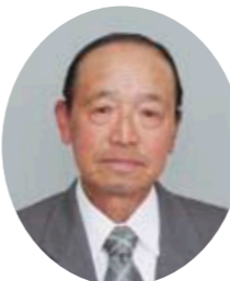
①磯部749 ②桜川市土地改良区推薦 ③担当地区/磯部、稲