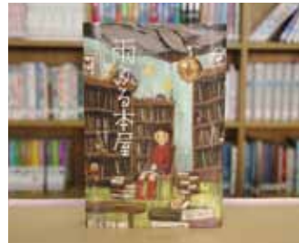
雨ふる本屋 日向 理恵子 作

貸出期間 ▼ 2週間(1人5冊まで) 開放時間 ▼ 9時~17時 休館日 ▼ 月曜日・祝日 問合せ ▼ ☎029617510344