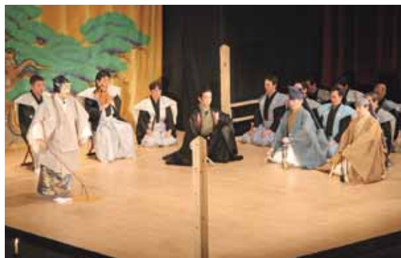
満員の観客の前で上演された世阿弥作の謡曲「桜川」

当日、上演された『能』は、世阿弥ゆかりの地である本市の磯部地区や桜川が舞台となつて、室町時代に作られた謡曲「桜川」。本格的な伝統芸能を鑑賞した満員の観客は、一時の幽玄の世界を堪能しました。