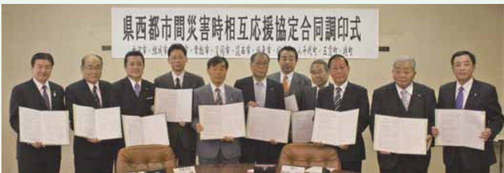
県西都市間災害時相互応援協定に調印した11自治体の首長の皆さん

項目には、食料・飲料水、生活必需品の提供、職員の派遣などのほか、笠間市の一部が東海第2原発から半径30km圏内に入ることから、原子力災害に伴う避難民の受け入れ施設の提供などが盛り込まれています。