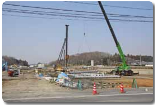
北関東自動車道の桜川筑西ICの開設にともない、桜川市の交通・流通・産業の拠点となる長方地区土地利用の見直しを実施。現在、民間活力による大型商業施設の建設が着工中の北関東自動車道の桜川筑西IC付近

市民の皆様におかれましては、ご理解ご協力いただきませう、よろしくお願いいたします。