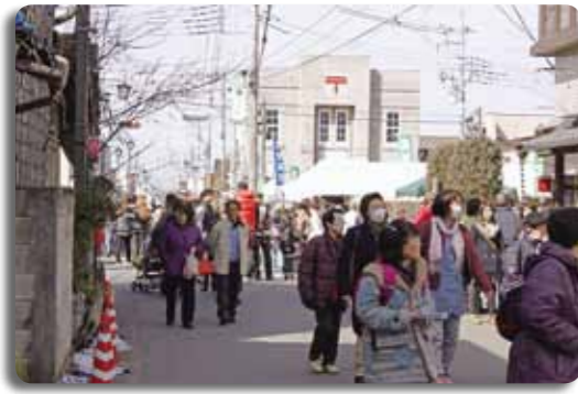
歴史的遺産や名所旧跡など数多くの観光資源を有する桜川市。中でも、期間中、毎年10余万人の観光客で賑わいを見せる市観光のメインイベント「真壁のひなまつり」

また、原子力発電所の事故に伴う、放射能の汚染問題につきましても、放射線量を継続的に測定するとともに、食の安全のため、学校給食や農産物の放射線量の測定も実施いたします。 また、不法投棄や水質・騒音の監視強化に努めるとともに、悪臭や野焼き・犬のフン害などの公害苦情に対する指導強化や、マナーアップの意識啓発を図ってまいります。さらに「日本一きれいなまちづくり」に向けても、職員自ら地域・職場における清掃活動を継続してまいります。