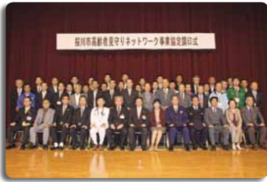
一人暮らし高齢者の孤立などが問題化されている昨今、高齢者の安心した生活を確保するために、市内外の52事業所と9関係機関が連携して高齢者の安否確認を展開していく「桜川市高齢者見守りネットワーク事業」の協定調印式