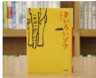
きいろいゾウ 西 加奈子 著

貸出期間 ▼ 2週間(1人5冊まで) 開放時間 ▼ 9時~17時 休館日 ▼ 月曜日・祝日 問合せ ▼ ☎029615817117