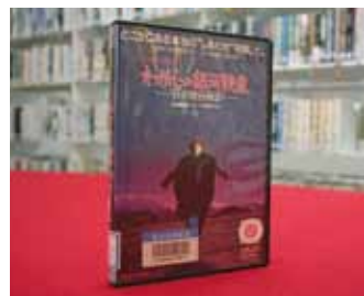
わが心の銀河鉄道 ～宮沢賢治物語～ 監督 大森一樹・主演 緒形直人

貸出期間 ▼ 2週間 (資料合計: 1人10冊まで) 開放時間 ▼ 平日10時～18時 土・日曜日9時～17時 休館日 ▼ 月曜日・祝日 問合せ先 ▼ ☎029612318525