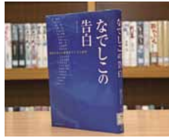
なでしこの告白 歴史を変えた最強女子21人の真実 週間サッカーマガジン 編集

貸出期間 ▼ 2週間 (1人5冊まで) 開放時間 ▼ 9時～17時 休館日 ▼ 月曜日・祝日 問合せ先 ▼ ☎029615817117