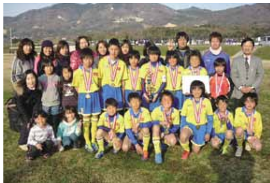
第6回スミハツカップで見事2連覇を達成した南飯田サッカースポーツ少年団と父兄の皆さん

市内をはじめ近隣の市町から総勢25チームが参加し、2日間のリーグ戦を展開しました。また、大会期間中は、東日本大震災被災地への義援金を募り、参加チームなどから集められた善意の義援金は、日本赤十字社を経由し被災地に送られました。