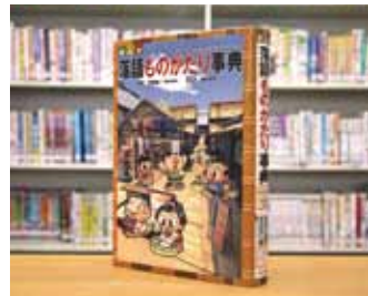
まんが落語ものがたり事典 矢野 誠一 監修

貸出期間 ▼ 2週間 (1人5冊まで) 開放時間 ▼ 9時～17時 休館日 ▼ 月曜日・祝日 問合せ先 ▼ ☎029617510344