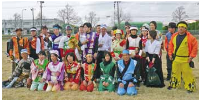
大和流鏑馬合戦に参加した選手と実行委員の皆さん

4月1日から、市役所の「グループ制」導入に伴い、本ページ担当が「市民協働推進室」から「統計・市民協働グループ」に替わりました。