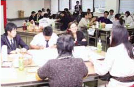
グループに分かれて活発な討議が行われました。

1つ目の小テーマ「語るう！桜川のいいところ」では、自然の豊かさや真壁のひなまつり、人の優しさなどが上げられました。2つ目の小テーマ「描こう！桜川の未来」では、自然や文化財などを活か