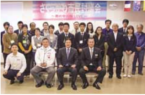
くさくらがわ市民協議会に参加した皆さん

市民協議会は、無作為に抽出された市民の方々が地域の課題やまちづくりについて話し合うもので、桜川市では昨年10月28日に初めて開催されました。