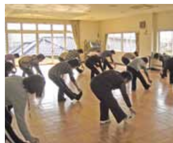
~スマート体操の会の様子~

スマート体操の会は発足より3年がたち2回桜川市社会体育研修センター(真壁)で、「二生自分の足で歩ける」を目標に日々、励んでいます。興味をお持ちの方、是非私たちと体操をしませんか。