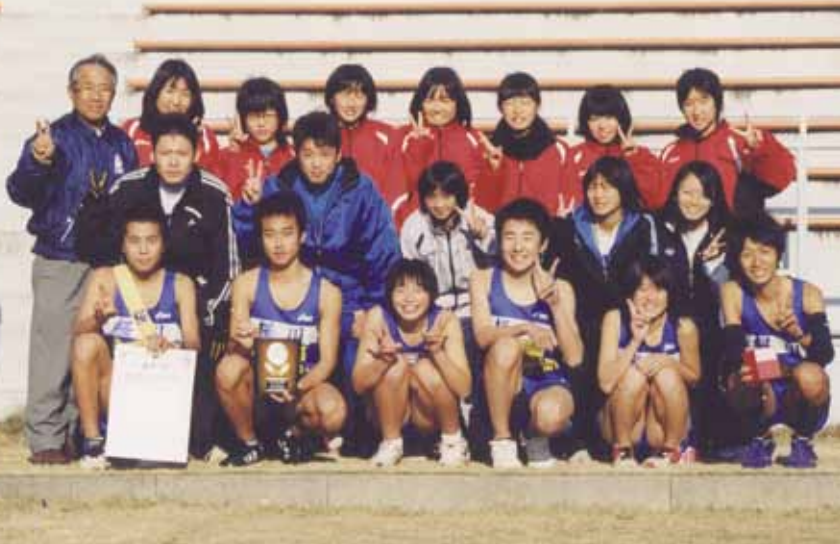
▲チームワークの良さを発揮し、6位入賞を果たしました。

に開催されているもので、市町村対抗の部には、17市町村から19チーム・223人の参加があり、激しいレース展開となりました。 桜川市チームは、選手一丸となってタスキを繋ぎ、7区では区間賞を獲得する健闘を見せるなど、桜川市の底力をアピールしました。