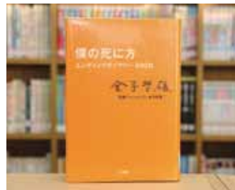
僕の死に方 エンディングタイアリー500日 金子 哲雄 著

貸出期間 ▼ 2週間(1人5冊まで) 開放時間 ▼ 9時～17時 休館日 ▼ 月曜日・祝日 問合せ ▼ ☎029617510344