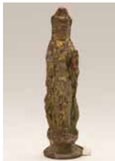
銅像観世音菩薩立像

鎌倉時代から戦国時代に鎌倉街道をみつめた出土品が語る鎌倉街道の歴史を、是非ご覧ください。