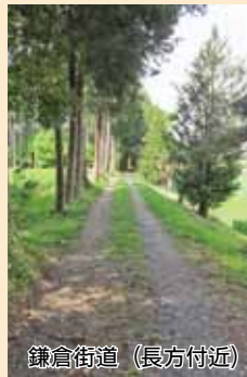
鎌倉街道 (長方付近)