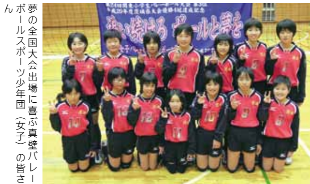
夢の全国大会出場に喜ぶ真壁バレーボール少年団(女子)の皆さん

真壁バレーボール少年団(女子) 夢の全国大会へ出場 昨年12月に開催された「茨城県スポーツ少年団スポーツ大会バレーボール大会」で、真壁バレーボール少年団(女子)が優勝を果たし、3月に高知県で行われる、第10回全国スポーツ少年団バレーボール交流大会への出場を決めました。70チームが出場した県大会では、同チームは接戦を制しながら勝ち上がり、全国大会を目標に頑張ってきた選手たちは喜びの涙を流していました。選手たちは「全国大会では『感謝と一生懸命』を合言葉に、茨城県代表として伸び伸び戦ってきます。」と話していました。