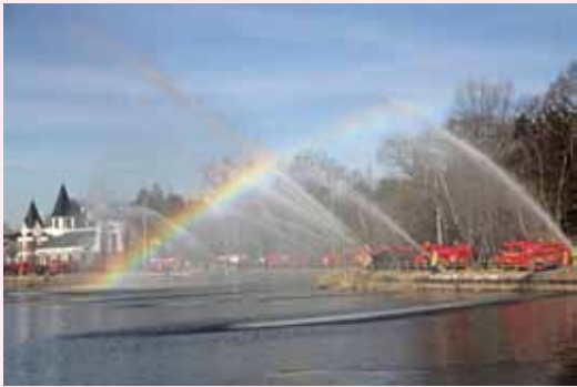
上野沼(岩瀬地区)での一斉放水