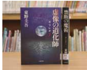
虚像の道化師・禁断の魔術 ガリレオ7・8 東野 圭吾 著

貸出期間 ▼ 2週間(1人5冊まで) 開放時間 ▼ 9時～17時 休館日 ▼ 月曜日・祝日 問合せ ▼ ☎029615817117