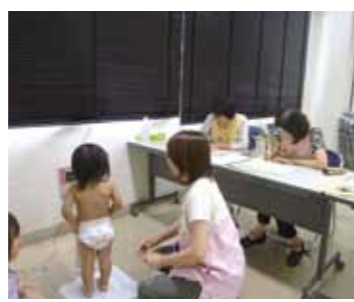
~乳幼児健診の様子~

■ 乳幼児健診の計測への協力 核家族が増える中、身近で母親の子育ての悩みをきいてあげられる存在になればとの思いで、笑顔で取り組んでいます。