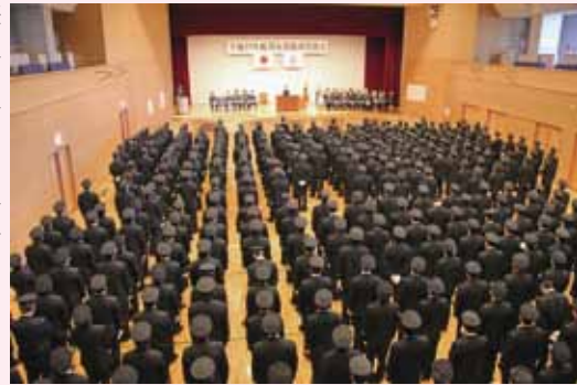
桜川市消防団・消防署など約550人が参加して行われた出初式の模様

終了後は、勇壮な分列行進と地域の安全を祈願して、地域の方が見守る中、上野沼(岩瀬地区)、精進沼(大和地区)、長者池(真壁地区)の市内3か所で一斉放水が行われました。