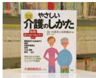
イラストでわかる やさしい介護のしかた 田中 元 著

貸出期間 ▼ 2週間(資料合計:1人10冊まで) 開放時間 ▼ 平日10時～18時 土・日曜日9時～17時 休館日 ▼ 月曜日・祝日 問合せ ▼ ☎029612318525