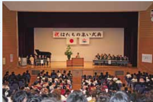
市内の新成人460人がシトラスで一堂に会し、「はたちの集い」が行われました。