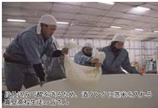
段仕込みで醪を造るため、酒タンクに蒸米を入れる 真壁高校生徒の皆さん