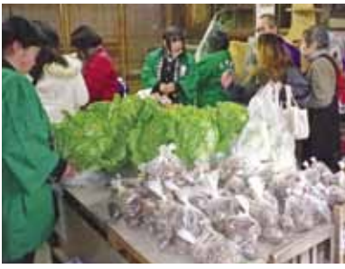
仲町休憩所には、真壁高校の生徒たちが育てた野菜が並べられ高校生八百屋が誕生

真壁の町中に賑わいをつくりたいという真壁八七咲き社中の皆さん。子どもたちに真壁の美味しいものや懐かしい遊びを伝えたいという桜川