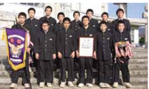
男子バレーボール部