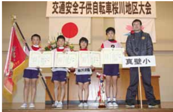
交通安全子供自転車桜川地区大会で連覇を達成した真壁小の皆さん

この大会は、桜川地区交通安全協会・警察署などの主催により開催されており、今回も市内の11小学校から44人の児童選手が参加。交通規制などの学科テストや安全・技能走行の実技テストが実施され、選手たちは一生懸命競技に臨みました。 団体の部は、真壁小が優勝、谷貝小が準優勝、第3位が雨引小。今後、真壁小・谷貝小の県大会での活躍が期待されます。