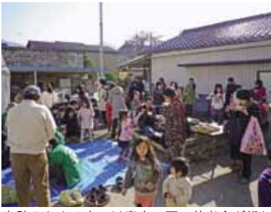
真壁八七まる市では青空の下、芋煮会が行われたたくさんの人が芋煮の味を楽しみました。

芋煮会も開催され、会場は和やかに賑わいました。市民団体が連携して始めた小さな試み。いくつかの団体が手を結ぶことで、大きな力を発揮します。近所の皆さんも加わり、真壁の新しいまちづくりが動き始めました。ひなまつりのように真壁八七まる市が定着することを期待しています。