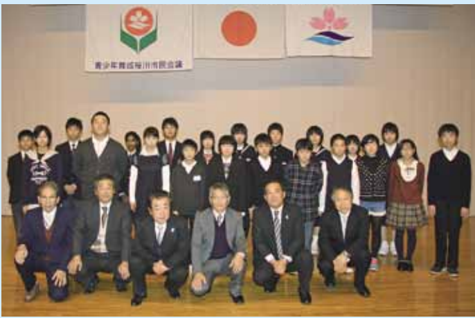
多くの来場者の中で堂々とスピーチを終えた児童・生徒たちと青少年育成桜川市市民会議役員の方々が一緒に記念撮影を行いました。

小学生の児童たちは、「将来の夢」「スポーツから学んだこと」「友達の大切さ」など集団生活の中で感じたことを発表し、中学・高校生たちからは、「障害者のために自分ができること」「いじめをなくすには」「動物の命の尊さ」「日常会話の中の言葉の持つ力」「桜川市の伝統文化の継承」などと題し、人を思いやる心とまちづくりについての発表がありました。