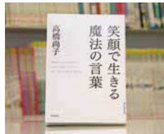
笑顔で生きる魔法の言葉 高橋 尚子 著

貸出期間 ▼ 2週間（資料合計：1人10冊まで） 開放時間 ▼ 平日10時～18時 土・日曜日9時～17時 休館日 ▼ 月曜日・祝日 問合せ ▼ ☎029612318525