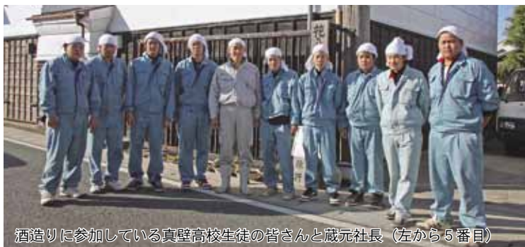
酒造りに参加している真壁高校生徒の皆さんと蔵元社長（左から5番目）

生徒の皆さんが、春の種撒きから秋の収穫まで丹精込めて作った醸造米コシヒカリは、日本酒造りが本格的に始