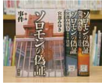
ソロモンの偽証 第Ⅰ～Ⅲ部 宮部 みゆき 著

貸出期間 ▼ 2週間（1人5冊まで） 開放時間 ▼ 9時～17時 休館日 ▼ 月曜日・祝日 問合せ ▼ ☎029615817117