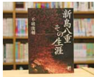
新島八重その生涯 不破 俊輔 著

貸出期間 ▼ 2週間（1人5冊まで） 開放時間 ▼ 9時～17時 休館日 ▼ 月曜日・祝日 問合せ ▼ ☎029617510344