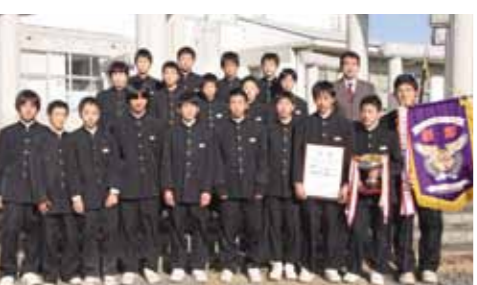
男子ソフトボール部

昨年10月末に開催された平成24年度茨城県中学校新入体育大会で、桃山中学校の男子バレーボール部、男子ソフトボール部が共に優勝しました。 男子バレーは全試合ストレート勝ちでの優勝。男子ソフトも好試合で9年ぶり2回目の優勝を果たしました。