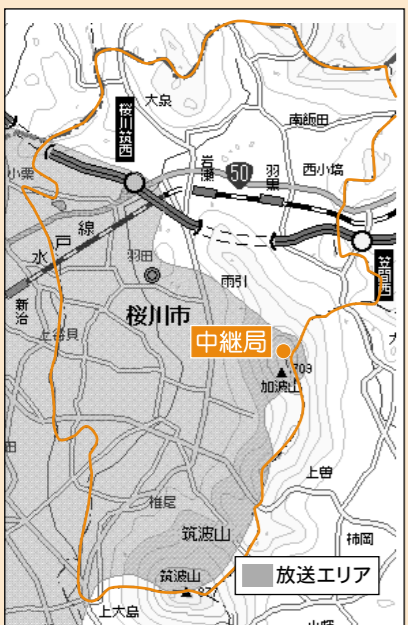
【筑西中継局の放送エリアの目安】 エリア内であっても地形や建物などの影響によって電波が遮られるなど、視聴できない場合もあります。

受信するためには、加波山向けのアンテナ（垂直偏波）と、この地域向けの混合器を追加する必要があります。