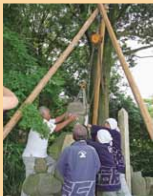
五輪塔などが崩落した震災直後の墓碑群

真壁石燈籠伝統工芸士会の皆さんが協力し、滑車で石を持ち上げ(写真右)、五輪塔の向きや角度も整えました(写真下)。