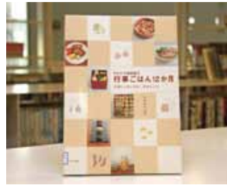
サルビア給食室の行事 ごはん12か月 フタナベマキ 著

貸出期間 ▼ 2週間（資料合計：1人10冊まで） 開放時間 ▼ 平日10時～18時 土・日曜日9時～17時 休館日 ▼ 月曜日・祝日 問合せ先 ▼ ☎ 029612318525