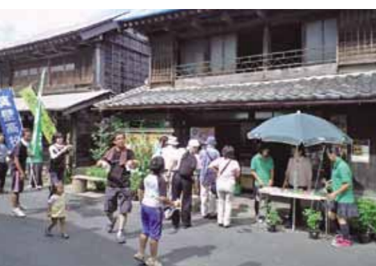
真壁地区の仲町休憩所付近で行われた「真壁、八七まる市」は多くの方で賑わっていました。

9月1日(土)真壁地区の仲町休憩所付近で「真壁八七まる市」が開催されました。 この市は、市民団体である真壁八七咲き社中、桜川本物づくり委員会、真壁高校の生徒たちが協働して行ったイベントで、市の目玉は、真壁高校の生徒たちが育てた朝採り野菜や甘い評判の梨の即売で、わずか30分で完売するほどの人気でした。 また、子ども達の思い出づくりとして流しそうめんやシャボン玉、紙飛行機飛ばしも行われ、会場は賑わっていました。 次回の「真壁、八七まる市」は、11月に開催される予定です。お楽しみに!