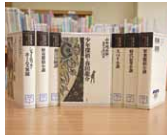
山本周五郎探偵小説全集 第1～6巻、別巻 山本 周五郎 著

貸出期間 ▼ 2週間（1人5冊まで） 開放時間 ▼ 9時～17時 休館日 ▼ 月曜日・祝日 問合せ先 ▼ ☎ 029615817117