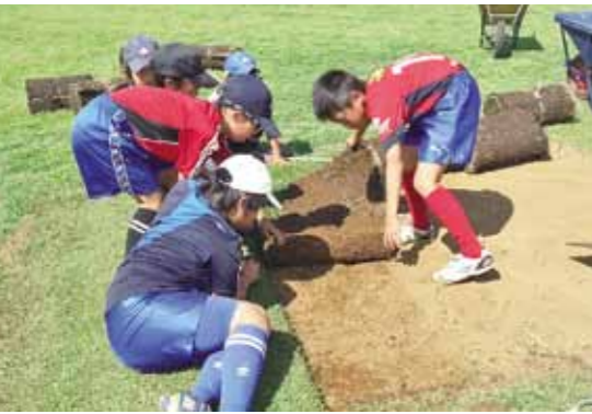
炎天下、子ども達と保護者などの協力で傷んだ芝を剥がし新しい芝に張り替える作業に汗を流しました。

8月5日(日)、真壁町桜井地内の桜井農村公園多目的広場で、傷んだ芝生を張り替える修復作業が行われました。 作業は、サッカーチーム真壁ジュニオールの子ども達と保護者の皆さんのほか、桜川・桃山中学校のサッカー部員あわせて約100名が参加して約半日をかけて行われました。 今回、張り替えた芝は、真壁ジュニオールの善意により寄付されたものです。きれいな芝生の広場で、これからも子ども達は運動などに汗を流すことができます。