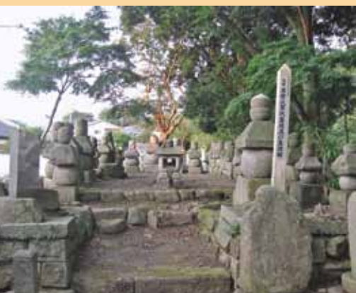
五輪塔の修復を終え整然と並べられた墓碑群