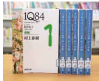
文庫 1Q84 Book 1～3 村上 春樹 著

貸出期間 ▼ 2週間（1人5冊まで） 開放時間 ▼ 9時～17時 休館日 ▼ 月曜日・祝日 問合せ先 ▼ ☎ 029617510344