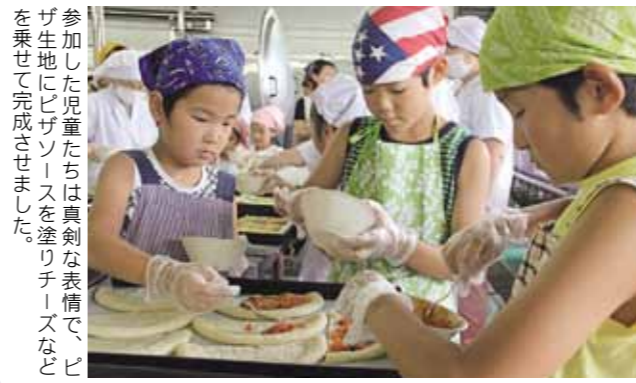
参加した児童たちは真剣な表情で、ピザ生地にピザソースを塗りチーズなどを乗せて完成させました。

岩瀬地区の児童が北学校給食センターの見学とピザ作りを体験 夏休み期間中、岩瀬地区の児童とその保護者が参加した「きゅうしよくセンター調べ隊」が実施され、桜川市北学校給食センターの見学とピザ作り体験をしました。 これは、同センターが「調理の様子や衛生管理の状態を知ってもらい、もっと給食を身近に感じてもらう。」と毎年開催しているもので、当日は、107人が参加。施設や調理の様子を見学後、ピザ生地へのソース塗りやチーズ乗せなどのピザ作りを体験しました。参加した子ども達からは「ピザソース塗り体験が楽しかった。」「来年もまた参加したい。」などの声が聞かれました。