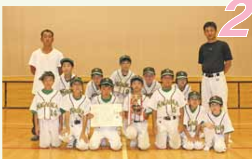
準優勝「長岡子ども会」