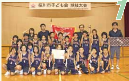
優勝「富士見台子ども会」

7月28日(土)、桜川市総合運動公園で、桜川市子ども会育成連合会主催による「桜川市子ども会球技大会」が開催されました。競技はソフトボールとドッジボールの2種目で、市内の子ども会チームがそれぞれ14チーム、13チームが参加。総勢約480名の選手が、熱戦を繰り広げました。また、今年から男子の参加が可能になったドッジボールでは、男子が活躍する姿が観られました。 ソフトボールは、トーナメント形式で行われ、4試合を勝ち上がった「羽鳥竹の子子ども会」が優勝。ドッジボールは、予選リーグ・決勝トーナメント形式で行われ、計8試合を戦った「富士見台子ども会」が優勝しました。なお、ドッジボールの部、上位2チームは、9月9日(日)に開催される「茨城県子ども会ドッジボール大会」に桜川市代表として出場します。