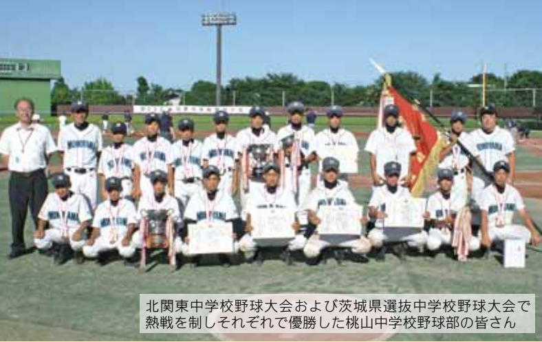
北関東中学校野球大会および茨城県選抜中学校野球大会で熱戦を制しそれぞれで優勝した桃山中学校野球部の皆さん