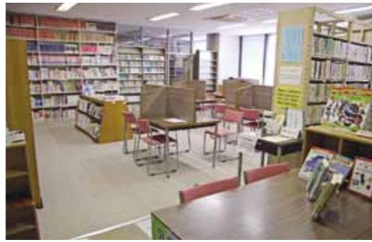
岩瀬中央公民館 図書室

また、本図書館に所蔵がない本などでも、他の市町村図書館からその本を取り寄せてご用意するサービスがございますので、受付カウンターへお申し込みください。お手元に届くまでには、4週間程度かかります。ぜひ、ご利用ください。