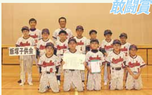
敢闘賞「飯塚子ども会」

7月28日(土)、桜川市総合運動公園で、桜川市子ども会育成連合会主催による「桜川市子ども会球技大会」が開催されました。競技はソフトボールとドッジボールの2種目で、市内の子ども会チームがそれぞれ14チーム、13チームが参加。総勢約480名の選手が、熱戦を繰り広げました。また、今年から男子の参加が可能になったドッジボールでは、男子が活躍する姿が観られました。 ソフトボールは、トーナメント形式で行われ、4試合を勝ち上がった「羽鳥竹の子子ども会」が優勝。ドッジボールは、予選リーグ・決勝トーナメント形式で行われ、計8試合を戦った「富士見台子ども会」が優勝しました。なお、ドッジボールの部、上位2チームは、9月9日(日)に開催される「茨城県子ども会ドッジボール大会」に桜川市代表として出場します。