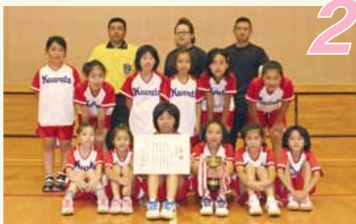
準優勝「飯塚子ども会」