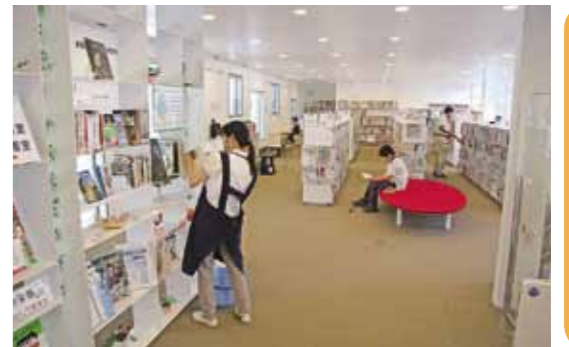
真壁伝承館 真壁図書館

立秋も過ぎ、朝夕の涼しさに秋の気配を感じる季節となりました。秋と言えば読書の秋です。市の図書館(室)に足を運んでみてはいかがでしょうか。思いがけない本に出会えるかもしれません。今月号では、同図書館(室)をご紹介します、多くの市民の皆様にご利用いただければと思います。