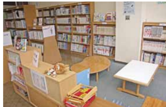
大和中央公民館 図書室