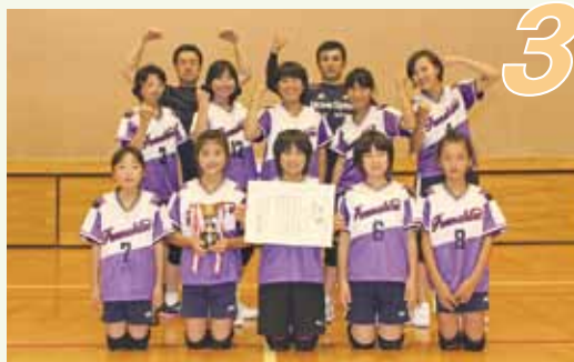
第3位「ジャンプガールズSP」