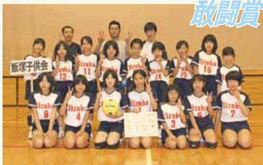
敢闘賞「飯塚子ども会」