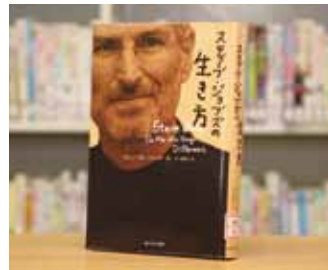
スティーブ・ジョブズの生き方 カレン・ブルーメンタル 著/ 渡邊 了介 訳

貸出期間 ▼ 2週間(1人5冊まで) 開放時間 ▼ 9時~17時 休館日 ▼ 月曜日・祝日 問合先 ▼ ☎029617510344