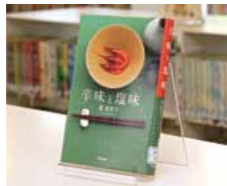
辛味と塩味 萬 眞智子 著

貸出期間 ▼ 2週間(資料合計:1人10冊まで) 開放時間 ▼ 平日10時~18時 土・日曜日9時~17時 休館日 ▼ 月曜日・祝日 問合先 ▼ ☎029612318525