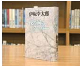
夜の国のクーパー 伊坂 幸太郎 著

貸出期間 ▼ 2週間(1人5冊まで) 開放時間 ▼ 9時~17時 休館日 ▼ 月曜日・祝日 問合先 ▼ ☎029615817117