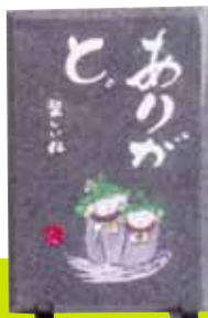
はがき大のサイズ

貸出期間 ▼ 2週間 (資料合計: 1人10冊まで) 開放時間 ▼ 平日10時~18時 土・日曜日9時~17時 休館日 ▼ 月曜日・祝日 問合せ ▼ ☎ 029612318525