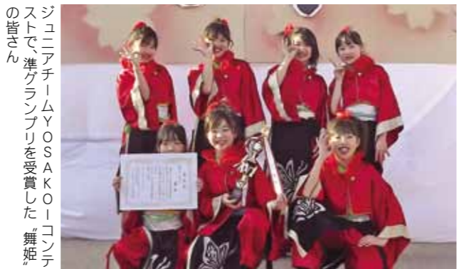
ジュニアチームYOSAKOIコンテストで、準グランプリを受賞した「舞姫」の皆さん

舞姫が、準グランプリ YOSAKOIかぬまフェスティバル 栃木県鹿沼市で開催された、YOSAKOIかぬまフェスティバル2012に、桜川市のYOSAKOIチーム「舞姫」が参加。ジュニアチームYOSAKOIコンテストで、準グランプリを受賞しました。 「舞姫」は、市内のイベントや県内外のYOSAKOIイベント、福祉施設などへの慰問活動を積極的に行っています。 今回の受賞で、参加メンバーは、「一生懸命練習しみんなと楽しく踊れ、準グランプリが獲れて、すごく嬉しい。次は、グランプリを目指したい」と話していました。