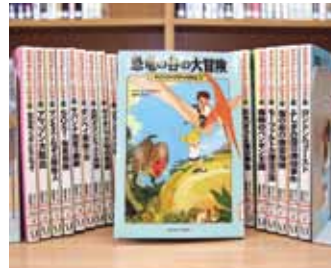
マジック・ツリーハウス 1~30 メアリー・ポープ・オズボーン 著

貸出期間 ▼ 2週間 (1人5冊まで) 開放時間 ▼ 9時~17時 休館日 ▼ 月曜日・祝日 問合せ ▼ ☎ 029615817117