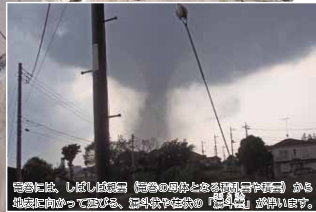
竜巻には、しばしば親雲(竜巻の母体となる積乱雲や積雲)から地表に向かって延びる、漏斗状や柱状の「漏斗雲」が伴います。今回、関東北部を襲った竜巻にも親雲の底から垂れ下がるように漏斗雲ができ、地表から巻き上げた水滴・ちりなどで、黒っぽい漏斗雲の軸が見えました。

丈夫な机やテーブルの下に入り、身を小さくして頭と首を守るなど、すぐに身を守るための行動をとってください。「竜巻による建物などの被害は防ぐことはできませんが、身の安全を守るための対策は可能です。」