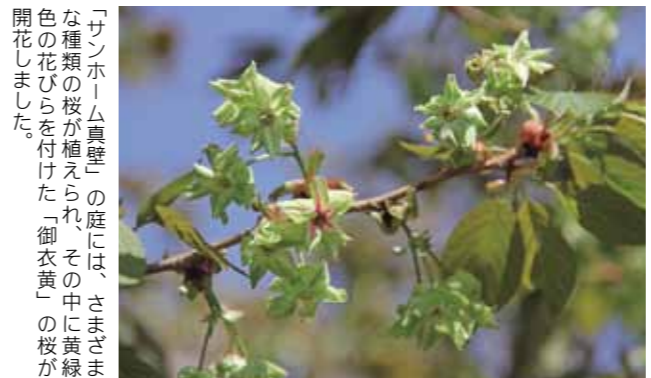
「サンホーム真壁」の庭には、さまざまな種類の桜が植えられ、その中に黄緑色の花びらを付けた「御衣黄」の桜が開花しました。

「サンホーム真壁」で 緑色の桜「御衣黄」が開花 特別養護老人ホーム「サンホーム真壁」（真壁町谷貝地区）で、緑色の花を付ける桜「御衣黄」や淡黄色の花を付ける「ウコンザクラ」など珍しい花が、入所者の目を楽かせていました。 「御衣黄」は、八重桜の一種で、中国から伝わりソメイヨシノより2週間ほど遅く開花するそうです。 同ホームでは、入所者にお花見を楽しんでもらおうと、3年ほど前に10種類の桜の植樹を行いました。「今後は、地域の方にも庭を開放し、多くの方に花見を楽しんでもらいたい。」と、話していました。