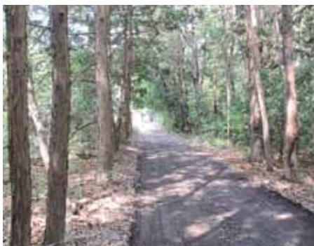
鎌倉街道(推定) 岩瀬地区・長方付近

歴史の道調査はこれからも続きます。古道に関する家の伝えや情報をお持ちの方は、桜川市文化財課まで、是非お知らせください。皆様の情報をお待ちしています。