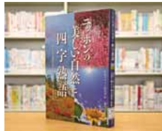
ニッポンの美しい自然と「四字熟語」 環境デザイン研究所 編

貸出期間 ▼ 2週間 (1人5冊まで) 開放時間 ▼ 9時~17時 休館日 ▼ 月曜日・祝日 問合せ ▼ ☎ 029617510344