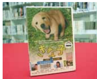
きな子 ~見習い警察犬の物語~ 監督 小林義則

貸出期間 ▼ 2週間 (資料合計: 1人10冊まで) 開放時間 ▼ 平日10時~18時 土・日曜日9時~17時 休館日 ▼ 月曜日・祝日 問合せ ▼ ☎ 029612318525