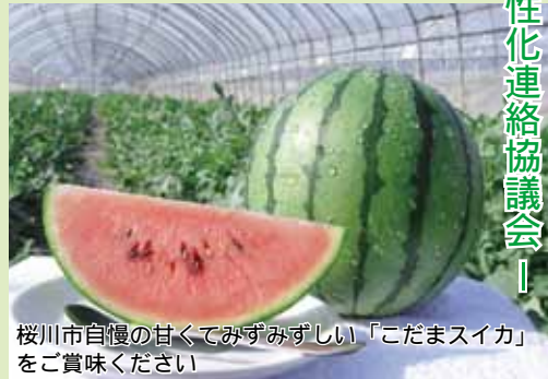
桜川市自慢の甘くてみずみずしい「こだまスイカ」をご賞味ください

スイカは、メロンのように追熟性を持った果実ではありませんので、買ってからご家庭で保存しても甘みが増すことはありません。完熟で食べ頃の時期に収穫していますので、できるだけ早く新鮮なうちに召味ください。