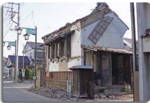
昨年3月に発生した東日本大震災は、市内のいたるところに大きな被害をもたらしました。真壁地区においては、重要伝統的建造物群保存地区の選定を受けた町並みも被災により一変しました。歴史的町並みの再生のためにも国・県の支援を受けながら歴史的建造物の復旧を推進してまいります。

景気の低迷に伴い雇用情勢の回復の兆しが見えず、低所得者層を取り巻く環境は厳しさを増しております。民生委員や関係機関との連携を密にし、相談・指導を行