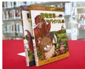
恐竜世界のサバイバル1・2巻 ホンシエチエル イテホ 文・李泰虎 絵 洪在徹 文・李泰虎 絵

貸出期間 ▼ 2週間(資料合計1人10冊まで) 開放時間 ▼ 平日10時~18時 土・日曜日9時~17時 休館日 ▼ 月曜日・祝日 問合先 ▼ ☎029612318525