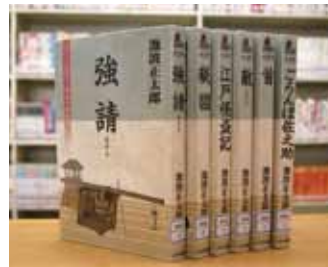
大きな活字で読みやすい本 池波正太郎 短編ベストコレクション全6巻 池波 正太郎 著

貸出期間 ▼ 2週間(1人5冊まで) 開放時間 ▼ 9時~17時 休館日 ▼ 月曜日・祝日 問合先 ▼ ☎029617510344