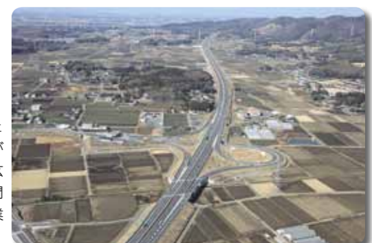
平成20年4月に北関東自動車道の桜川筑西IC(インターチェンジ)が開通され、平成23年3月には、北関東自動車道が全線開通しました。これにともない、桜川筑西ICは東西の玄関口となることから、周辺の土地利用の見直しを図り、民間活力による開発の誘導を引き続き促進し、交通・流通・産業の拠点となるような施策を展開してまいります。