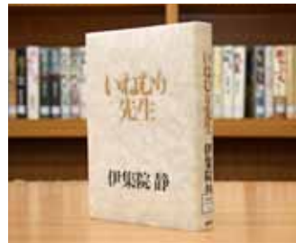
いねむり先生 伊集院 静 著

貸出期間 ▼ 2週間(1人5冊まで) 開放時間 ▼ 9時~17時 休館日 ▼ 月曜日・祝日 問合先 ▼ ☎029615817117