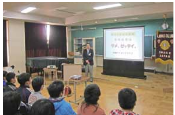
岩瀬ライオンズクラブが坂戸小の6年生児童とその保護者を前に行った「薬物乱用防止教室」の様子

参加した児童は、「薬物がこんなに恐ろしいものなんだと改めて知った。もし誘われたら、勇気を出して断りたい。」と話していました。