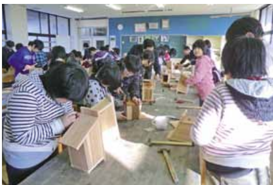
巣箱づくりに参加した児童たちは、慣れない手つきで金槌などを扱い巣箱を完成させました。