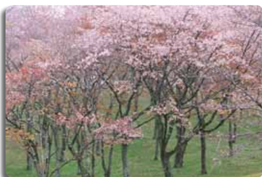
国の名勝に指定されている「桜川(磯部地区)」。磯部地区には、4月、白山桜を中心として磯部稲村神社と磯部桜川公園一帯に約1,000本の桜が咲き誇ります。これらの山桜群は天然記念物にも指定されており、毎年、桜まつり期間中は、観光客などで賑わう観光地となっています。今後は交通アクセスを検討し観光宣伝の強化を図ってまいります。

ます。市民の皆様におかれましては、ご理解ご協力いただきまますよう、よろしくお願いたします。