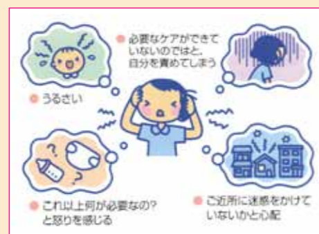
〈泣かれたときのお母さんの気持ち〉

泣かれたら、赤ちゃんを安全な場所に寝かせて、まずは自分を取り戻そう。数分したらもう一度戻って赤ちゃんの様子を確認しましょう。