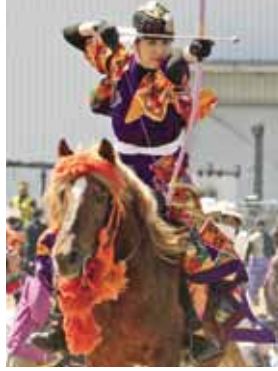
昨年の流騎馬競技大会の様子

実行委員会では、大会の運営 をお手伝いしていただけるボラ ンティアを募集しています。関 心のある方はぜひご連絡くださ い。