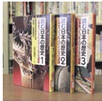
読む日本の歴史 (日本をつくった人びとと文化遺産) 古川 清行

貸出期間 ▼ 2週間 (1人5冊まで) 開放時間 ▼ 9時~17時 休館日 ▼ 月曜日・祝日 問合せ先 ▼ ☎ 029617510344