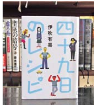
四十九日のレシピ 伊吹 有喜

貸出期間 ▼ 2週間 (1人5冊まで) 開放時間 ▼ 9時~17時 休館日 ▼ 月曜日・祝日 問合せ先 ▼ ☎ 029615511111