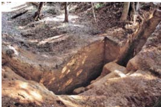
戦国の剣豪・塚原ト伝の城 塚原館跡 (鹿嶋市)

■問合せ・申込先/文化生涯学習課 資料館係 (☎ 58-5111・75-3111、内線3224)