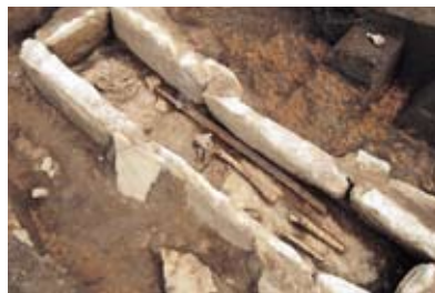
出土した古墳の石棺(6世紀半ば)。内部には人骨と刀などが見えます

が1体眠っており、その傍らには鉄の刀1振と、鉄の鏃(矢の先端部のこと)9本が置かれていました。