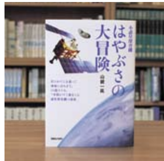
小惑星探査機 はやぶさの大冒険 山根 一眞

貸出期間 ▼ 2週間 (1人5冊まで) 開放時間 ▼ 9時~17時 休館日 ▼ 月曜日・祝日 問合せ先 ▼ ☎ 029615817117