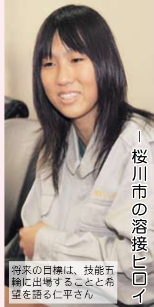
―桜川市の溶接ヒロイン誕生―