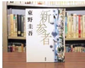
新参者 東野 圭吾

貸出期間 ▼ 2週間（1人5冊まで） 開放時間 ▼ 9時～17時 休館日 ▼ 月曜日・祝日 問合せ先 ▼ 0296175103