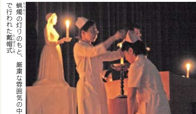
蝋燭の灯りのもと、厳粛な雰囲気の中で行われた戴帽式

6月9日、岩瀬高校体育館で、第39回戴帽式が行われました。岩瀬高校衛生看護科3年生の40人が枝川校長からナースキャップを戴き、蝋燭に火を灯しました。そして、「ナイチンゲール誓詞」を唱え、ナイチンゲールの精神を受け継ぎました。「看護学習に誇りを持って取り組んでほしい」「患者様に対する思いやりに身に付けてほしい」と校長先生のあいさつの後、生徒代表者が「ナイチンゲールの心を忘れることなく患者様に尽くすことを誓います。」と、宣誓しました。