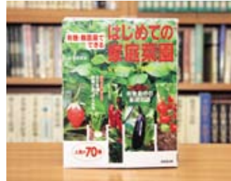
有機・無農薬でできる はじめての家庭菜園 金子 美登

貸出期間 ▼ 2週間（1人5冊まで） 開放時間 ▼ 9時～17時 休館日 ▼ 月曜日・祝日 問合せ先 ▼ 0296158171