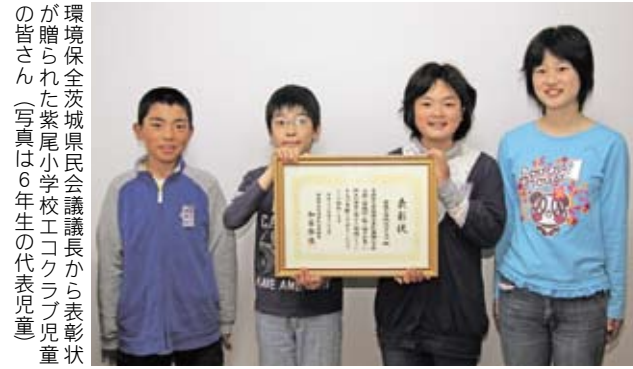
環境保全茨城県民会議議長から表彰状が贈られた紫尾小学校エコクラブ児童の皆さん（写真は6年生の代表児童）

桜川市立紫尾小学校エコクラブは、自分でできる身近な環境保全活動に取り組んできたことが認められ、環境保全茨城県民会議議長から表彰状が贈られました。紫尾小学校では、平成20年度から3年生以上の児童全員が「こどもエコクラブ」に加入。4年生の児童が提案したエコキャップ集めをきっかけに、4年生や6年生での牛乳パックの回収、全校でのアルミ缶の回収などリサイクル活動の取組みを実施していることが今回認められたものです。