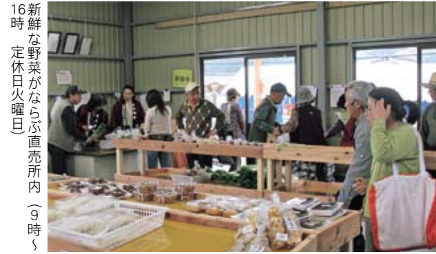
新鮮な野菜がならぶ直売所内（9時〜16時 定休日火曜日）

4月28日、大泉地区（つくば益子線沿）に、桜川北部ふるさとづくり協議会による直売所「さくら」がオープンしました。直売所一帯は、市内の農村集落モデルに発展させることを目的に整備しており、同協議会は丘陵地帯を拠点にした農産物直売や農業体験による地域住民や都市住民（消費者）との交流を図り、景観を保全し、持続性のある活動を行っています。直売所には、朝採りたての新鮮な農産物や特産品がありますので、ぜひ一度足を運んでみてください。