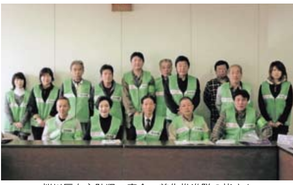
桜川区自主防犯・安全・美化推進隊の皆さん

また、「みんなが主役のまちづくり指針」は、市ホームページ内市政情報のお知らせの中にありますので、そちらもご覧ください。