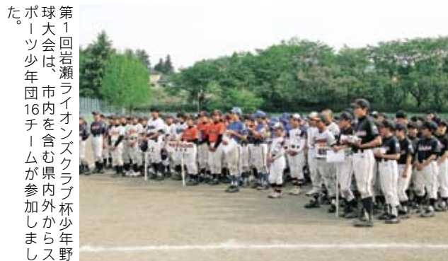
第1回岩瀬ライオンズクラブ杯少年野球大会は、市内を含む県内外からスポーツ少年団16チームが参加しました。

5月8日（土）桜川運動公園などを会場に、第1回岩瀬ライオンズクラブ杯少年野球大会が開催されました。この大会は「青少年の健全育成」「社会で活躍できる人材育成」に貢献することを目的に実施され、6年生の部と5年生以下の部の各々の組合せで県内外から16チームが集まり熱戦が繰り広げられました。惜しくも市内チームから上位入賞はありませんでしたが、個人賞では、市内スポーツ少年団から優秀選手賞が4人、敢闘賞が1人選ばれました。