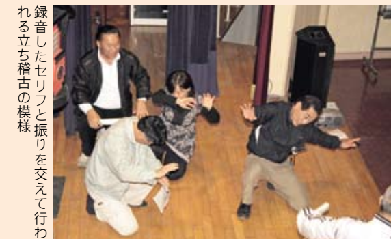
録音したセリフと振りを交えて行われる立ち稽古の様相。