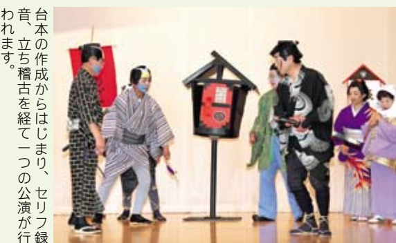
台本の作成からはじまり、セリフ録音、立ち稽古を経て一つの公演が行われます。