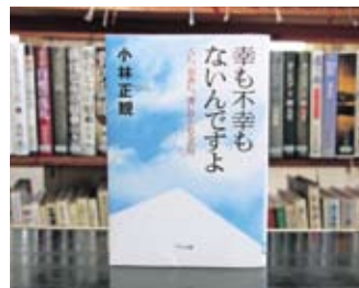
幸も不幸もないんですよ 小林正観 マキノ出版

貸出期間 ▼ 2週間（1人5冊まで） 開放時間 ▼ 9時～17時 休館日 ▼ 月曜日・祝日 問合せ先 ▼ 0296155111