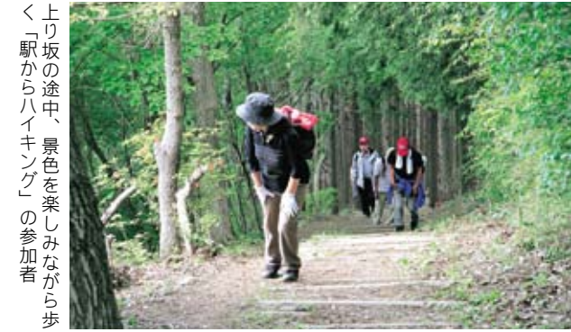
上り坂の途中、景色を楽しみながら歩く「駅からハイキング」の参加者

5月16日（日）JR東日本主催の「駅からハイキング」が市内で開催され、参加者は岩瀬地区の御嶽山から雨引山を経由して、つくばりんりんロードを歩きました。岩瀬駅で下車した参加者は、コースマップを受取り出発しました。歩行距離約14kmのこのコースは、眺めの良い人気のコースで普段から利用者も多く、コース上では地元ボランティアの飲食物のサービス、手打ち蕎麦のもてなしもあり、参加者は初夏の陽気の中、ハイキングを楽しみました。