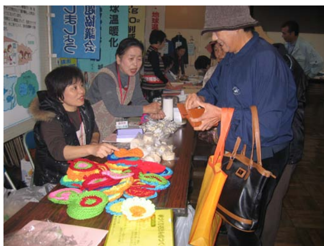
消費者展でのアクリルたわしの紹介