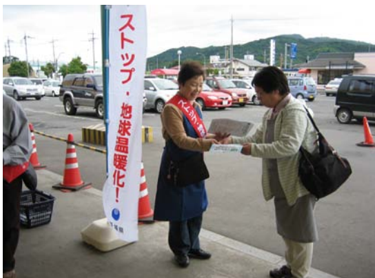
地球温暖化防止を呼びかける街頭キャンペーンの様子