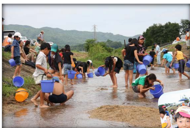
桜川にフナの稚魚放流