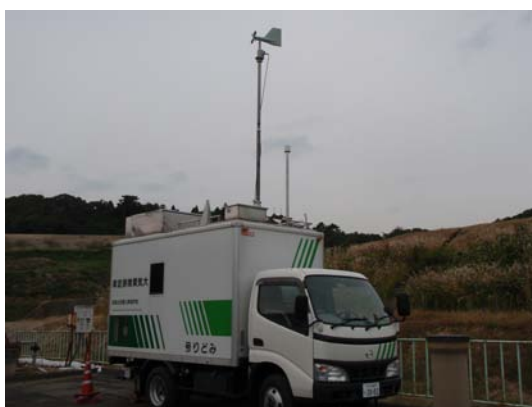
大気環境移動測定車