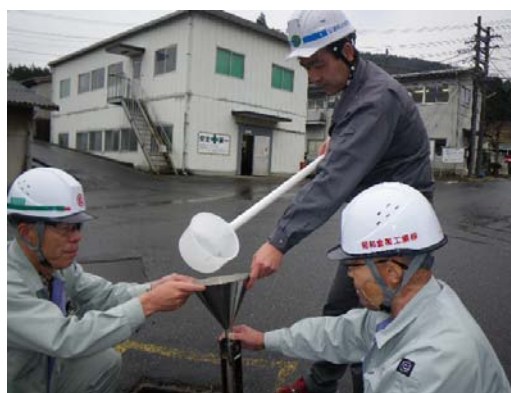
工場排水の水質検査