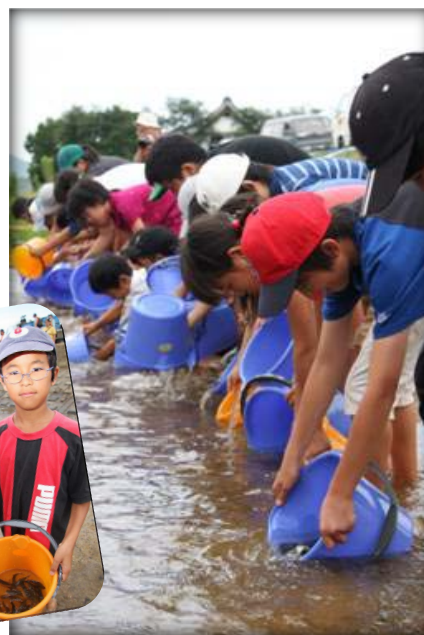
「桜川探検隊」の活動の様子