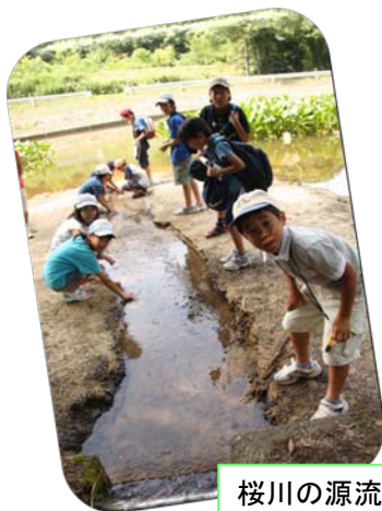
桜川の源流「鏡ヶ池」にて