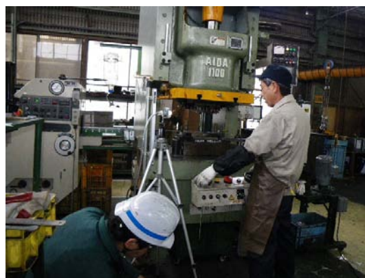
工場の粉じん測定