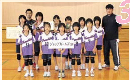
第3位「ジャンプガールズSP」