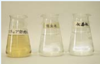
水道水に近い状態まで処理してから放流します。

筑北環境衛生組合「クリーンセンター」は、霞ヶ浦富栄養化防止条例の施行により新設され、昭和61年3月より稼働が開始されました。 センターでは現在、桜川市全域と笠間市（旧笠間地域）の各家庭から収集される浄化槽汚泥・し尿を処理しています。桜川市の下水道の普及率は約17%