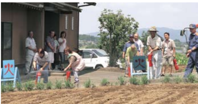
昨年度結成された加茂部第2区の訓練の様子。桜川消防署員から消火器の使用方法についての講習を受けました。