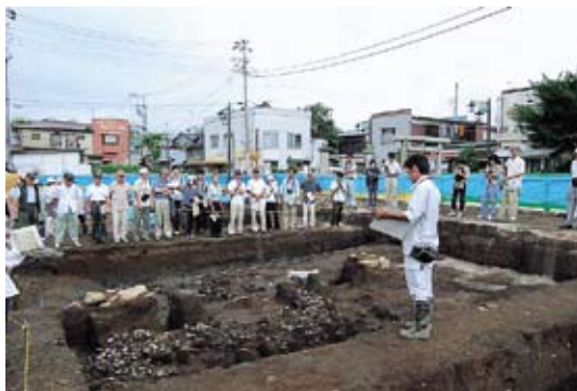
発掘調査現地説明会のようす (8月8日)