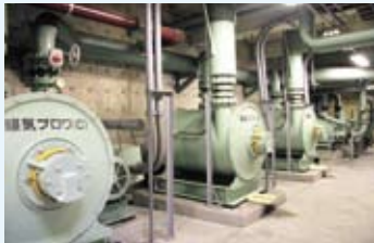
攪拌しながら微生物の働きによって分解されます。