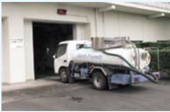
市内の各家庭から収集され、施設内に投入されます。