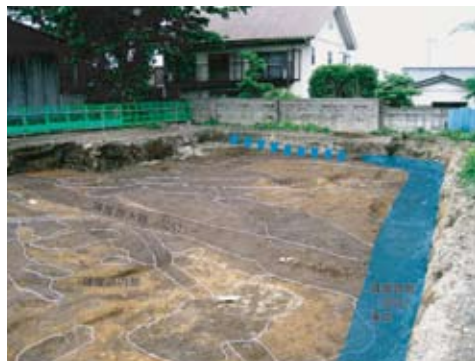
陣屋跡の堀 (東辺・旧母子健康センター下付近)

江戸時代より古いものでは、古墳や中世の建物跡がありました。特に中世の遺構・遺物は真壁の歴史的町並みが戦国時代の