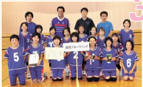
第3位「猿田ブルーウィング」