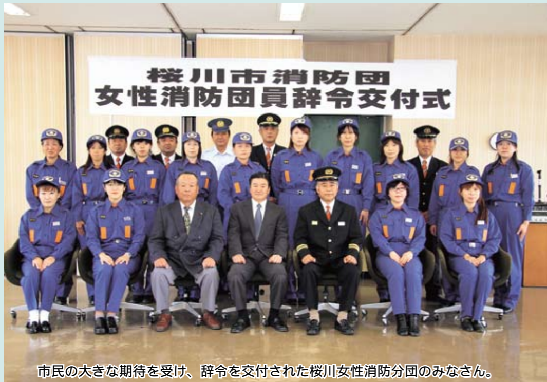
市民の大きな期待を受け、辞令を交付された桜川女性消防分団のみなさん。