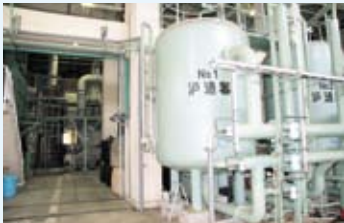
ろ過処理水は活性炭によって一層良質なものになります。