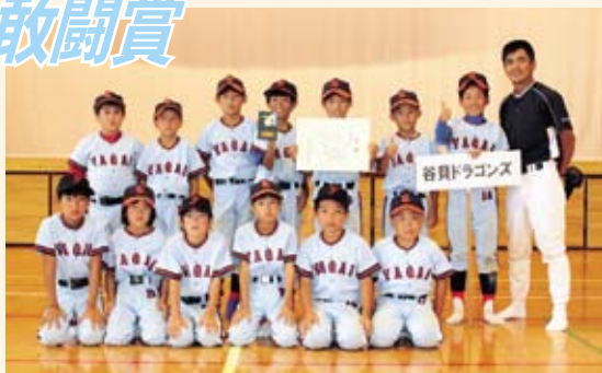
敢闘賞「谷貝ドラゴンズ」