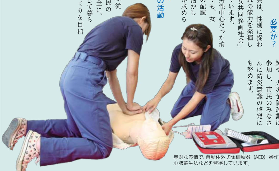
真剣な表情で、自動体外式除細動器 (AED) 操作、心肺蘇生法などを習得しています。

女性分団は、原則火災などの災害活動には従事せず、市民の皆さんが安全に、そして安心して暮らせるまちづくりを目指します。