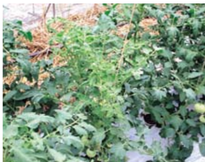
黄化葉巻病が発病したトマトの苗

・わき芽も同様に芯が黄色くなり、成長が止まります。 家庭菜園栽培者の皆様にご協力をお願いいたします。