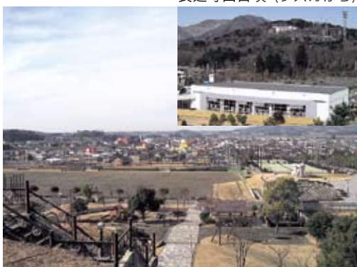
岩瀬地区市街地 現代の発展のルーツは古墳時代にありました。

いつ頃成立したのかを探る貴重な資料になると思います。発掘の成果や資料については、今後も広報や企画展示などで紹介します。