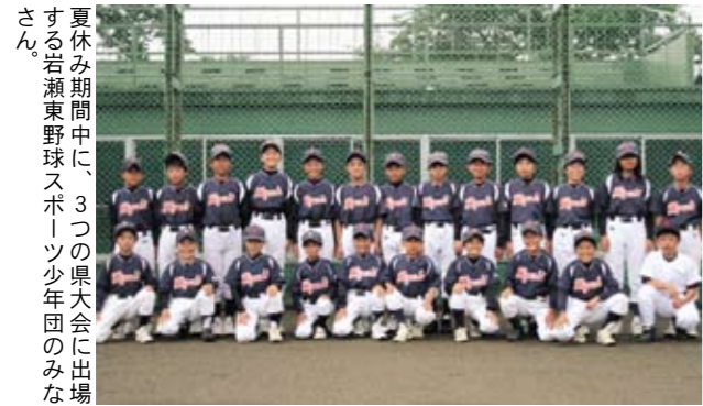
夏休み期間中に、3つの県大会に出場する岩瀬東野球スポーツ少年団のみなさん

市内の岩瀬東野球スポーツ少年団が、夏休み期間中に開催される3つの県大会出場に向けて、日々練習に励んでいます。 7月25日の「県スポーツ少年団大会」と、8月22日の「県ちびっ子軟式野球選手権大会」には、県西地区の代表として出場。8月1日に開催される「第5回ノーブルホームカップ学童野球大会」では、県内105チームが15ブロックに別れて行われた予選大会を勝ち上がり、決勝トーナメントに進出しました。 各大会では、練習の成果を発揮し、頑張ってください。