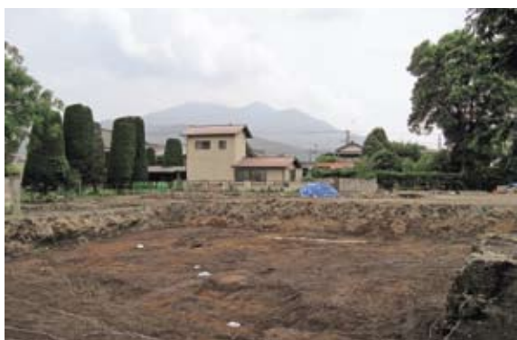
歴史の風景 No.2 真壁陣屋からみた筑波山 陣屋跡の北東部（資料館跡北側付近からみた筑波山）

江戸時代の人々も同じ風景をながめたことでしょう。次回は岩瀬地区の風景です。お楽しみに。