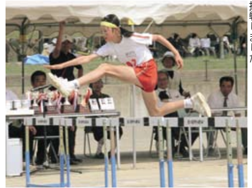
子ども達は持てる力を発揮し、記録に挑戦しました。