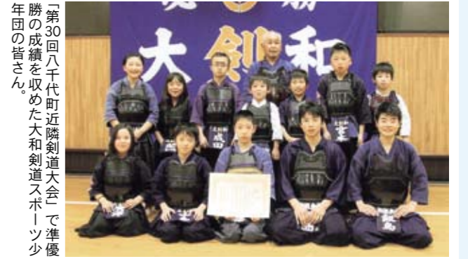
「第30回八千代町近隣剣道大会」で準優勝の成績を収めた大和剣道スポーツ少年団の皆さん。

八千代町で開催された「第30回近隣剣道大会」で、桜川市から参加した大和剣道スポーツ少年団(大和剣友会)が、団体戦の部で準優勝という好成績を収めました。 同少年団はこの大会に、4年生1人、5年生4人の編成で参加しましたが、6年生主体に編成された他のチームを相手に、互角の活躍を見せて見事に勝利し、準優勝を飾りました。 現在、次の大会に向けて一丸となって練習に励んでいます。今後の活躍が期待されます。