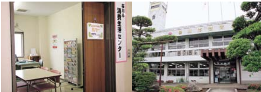
岩瀬庁舎の2階に開設した「桜川市消費生活センター」には、専門の相談員が常駐しています。

■相談場所／桜川市消費生活センター（市役所岩瀬庁舎2階） 相談専用電話／☎0296-7516300