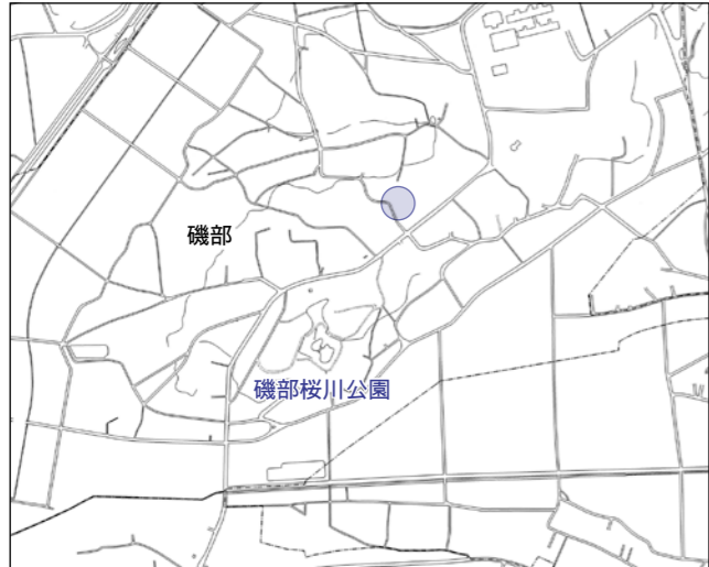
地図【色付部分内】(磯部地区) 物件番号8