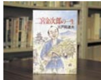
二宮金次郎の一生 三戸岡 道夫

貸出期間 ▼ 2週間(1人5冊まで) 開放時間 ▼ 9時~17時 休館日 ▼ 月曜日・祝日 問合せ先 ▼ 029617510344