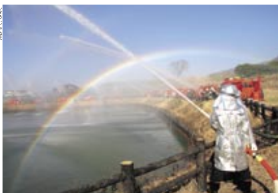
精進沼(大和地区)で行われた一斉放水の模様