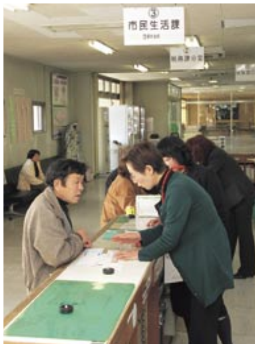
支所に配置されていた保健福祉課や税務課分室などが「総合窓口課」となりますが、証明書の発行・申請手続きなどは、従来どおり支所の総合窓口課で取り扱います。