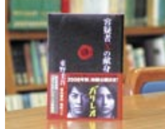
容疑者Xの献身 東野 圭吾

貸出期間 ▼ 2週間(1人5冊まで) 開放時間 ▼ 9時~17時 休館日 ▼ 月曜日・祝日 問合せ先 ▼ 029615817117