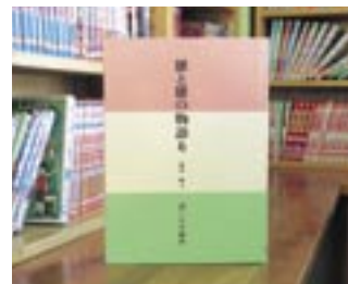
雑と雑の物語り 藤田 順子

貸出期間 ▼ 本・2週間(1人5冊) / ビデオ・1週間(1人1本) 開放時間 ▼ 9時~17時 休館日 ▼ 月曜日・祝日 問合せ先 ▼ 029615510159