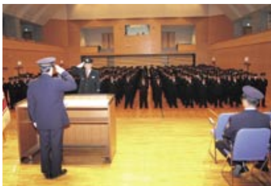
桜川市消防団・消防署など約550人が参加して行われた出初式の模様

日頃から防火・防災の思想の普及を図ると共に団員一人ひとりが日々訓練を重ね、万が一の火災や災害に際しては団員が一致団結して任務を全うする覚悟です。」と、今年一年間の防災への決意を新たにしました。終了後、勇壮な分列行進と地域の安全を祈願して、上野沼(岩瀬地区)・精進沼(大和地区)に分かれて、一斉放水が行われました。