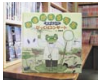
あまがえる先生 ミドリ池きゅうしゅつ大さくせん 松岡達英

貸出期間 ▼ 本・2週間（1人5冊） ▼ ビデオ・1週間（1人1本） 開放時間 ▼ 9時～17時 休日 ▼ 月曜日・祝祭日 問合せ先 ▼ 029615510159