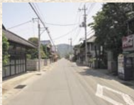
③西小塙・加茂部地区には、旧街道の宿のたたずまいが残っています。