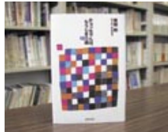
チヨツちゃんは もうじき 100 歳 黒柳 朝

貸出期間 ▼ 2週間（1人5冊まで） 開放時間 ▼ 9時～17時 休日 ▼ 月曜日・祝祭日 問合せ先 ▼ 029617510344