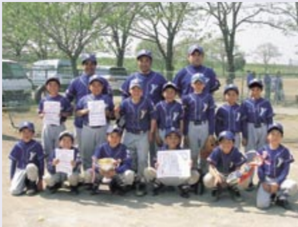
真壁郡学童野球大会2連覇で、5度目の優勝に輝いた大和ファイターズのみなさん

この大会は、学童野球の技術向上と友好・親睦を図ることを目的に開催されるもので、今年で7回を迎えます。今大会には、旧真壁郡の強豪12チームが参加。随所に学童野球とは思えない白熱したプレーが見られました。同チームは、準決勝まで危なげなく駒を進め、準決勝・決勝では持ち前の粘りあるプレーを発揮。同大会2連覇で5度目の優勝に輝きました。また、本市から参加のピーチスターズも第3位の成績を収めました。