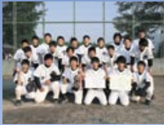
準優勝の桃山中学校男子ソフトボール部のみなさん