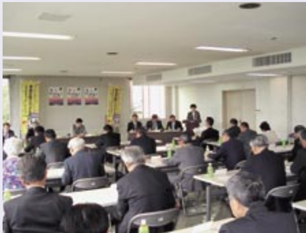
国民文化祭・いばらき2008が茨城県で開催されるのを受けて、市文化協会・市観光協会・JA・JR東日本などの関係者が参加して桜川市実行委員会が組織されました。

国民文化祭とは、全国各地から文化・芸術活動の愛好者が集い、音楽や演劇・伝統文化の競演、一般公募の文芸や美術作品の展示、さらに開催地独自の文化・芸術イベントなどを行う国内最大の文化・芸術の祭典です。本市では、事業として『ストーン文化フェスティバル』および『筑波嶺と万葉文化フェスティバル』を開催いたします。この中で7つのプログラムを予定しております。開催まで、本紙で随時ご紹介して参りますので、どうぞご期待ください。