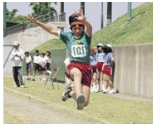
子ども達は持てる力を出し切り頑張りました。