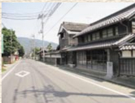
④真壁地区の見世蔵群