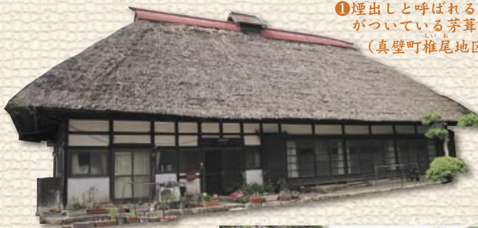
①煙出しと呼ばれる小屋根がついている茅葺きの家 (真壁町椎尾地区)