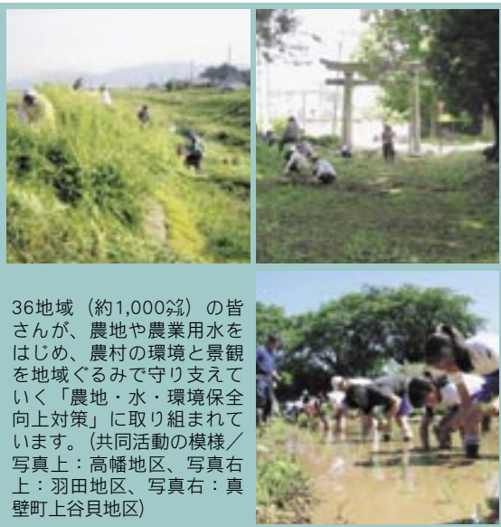
36 地域（約 1,000 鈔）の皆さんが、農地や農業用水をはじめ、農村の環境と景観を地域ぐるみで守り支えていく「農地・水・環境保全向上対策」に取り組まれています。（共同活動の様様／写真上：高橋地区、写真右上：羽田地区、写真右：真壁町上谷貝地区）

本市では、36 地域の約千鈔で取組みが行われています。該当地域の皆様には、積極的な参加をお願いいたします。