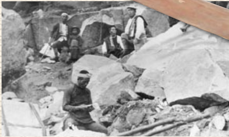
②石屋職人の仕事着