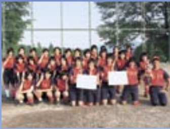
第3位の桃山中学校女子ソフトボール部のみなさん

本市開催31年目を迎えた同大会には、県内各地から男子6チーム・女子36チームが参加。爽やかな五月晴れの下、熱戦が繰り広げられ、本市から参加の桃山中学校男子ソフトボール部が準優勝、同校女子ソフトボール部が第3位の成績を収めました。