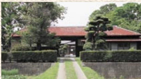
②長屋門のある家 (大国玉地区)