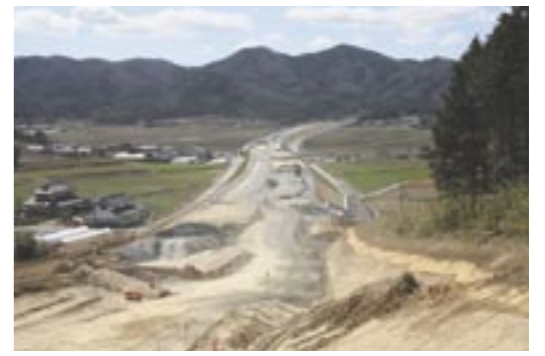
平成20年10月開通に向け、北関東自動車道の工事も順調に進んでおります。さらに、筑西幹線道路の整備計画と併せ、桜川市の交通基盤は向上することから将来を展望し、地の利を活かした施策を講じながら企業誘致などに積極的に取り組んでまいります。