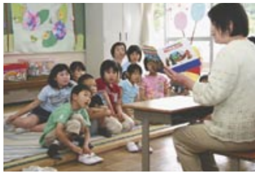
子育て支援の促進については、放課後などにおける児童の健全育成と子育て支援を図るため、放課後児童対策事業を引き続き実施してまいります。また、次代の社会を担う子どもが健やかに生まれ、かつ、育成される環境の整備を図るため次世代育成支援行動計画のもとに、子育て支援を総合的に推進してまいります。(写真/放課後を利用した学童保育読み聞かせ)

的な在宅福祉サービスが提供できるように、地域ケアシステム事業を推進してまいります。障害者福祉については、昨年4月に施行された「障害者自立支援法」に基づき、障害者の自立と社会参加の一層の促進を図るため、障害者福祉計画の推進を図ってまいります。