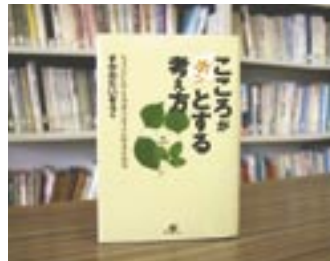
こころがホッとする考え方 すがの たいそう

貸出期間 ▼ 2週間(1人5冊まで) 開放時間 ▼ 9時~17時 休館日 ▼ 月曜日・祝祭日 問合先 ▼ ☎ 029617510344