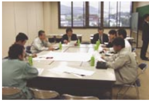
桜川市は、経済産業省の市町村産業振興ビジョン調査モデル事業として、全国で7地区のひとつに選定され、地方自治体の自助努力と人材活用で地域活性化を図ることを目的として、経済・まちづくりなどの専門家と地域代表をまじえ、地域の産業振興を進めてまいります。

が決まり、また、平成20年度からは、水道事業会計も一本化されることになりました。安全で良質な水道水の安定的供給を図るため、収入の確保、さらに公営企業としての経営の効率化および健全化に努めてまいります。