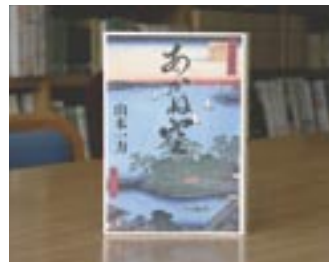
あかね空 山本 一カ

貸出期間 ▼ 2週間(1人5冊まで) 開放時間 ▼ 9時~17時 休館日 ▼ 月曜日・祝祭日 問合先 ▼ ☎ 029615817117