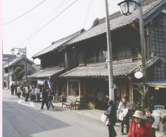
桜川市「陣屋町真壁の歴史的街並み」が、次世代に継承すべき歴史的風土として「美しい日本の歴史的風土 準100選」に選定されました。

これは、同財団が古都保存法施行 40周年を記念して、今後の古都保存行政の発展と全国に残る次世代に継承すべき歴史的風土の保存・継承を目的に、美しい日本の歴史的風土が良好に残されている地域を募集。全国から、遺跡や神社仏閣・古い街並み・棚田や港町の風景など様々な歴史的風土 698件の応募がありました。本市は、真壁地区の真壁城跡と江戸時代に築かれた陣屋を核とする町割りがあり、そこに近世から戦前にかけて商業中心地として栄えた町があることが評価されました。