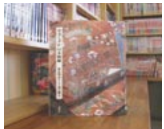
草乃しずか日本刺繍 源氏物語そして命の輝き 草乃 しずか

貸出期間 ▼ 本・2週間(1人5冊) / ビデオ・1週間(1人1本) 開放時間 ▼ 9時~17時 休館日 ▼ 月曜日・祝祭日 問合先 ▼ ☎ 029615510159