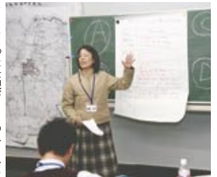
▶まとまった景観づくりのルールを各班で発表し合うことで、結果の共有化がはかられます。