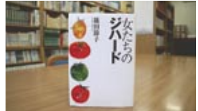
女たちのジハード 篠田節子