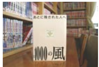
あとに残された人へ 1000の風 作者不明 / 訳者: 南風 椎