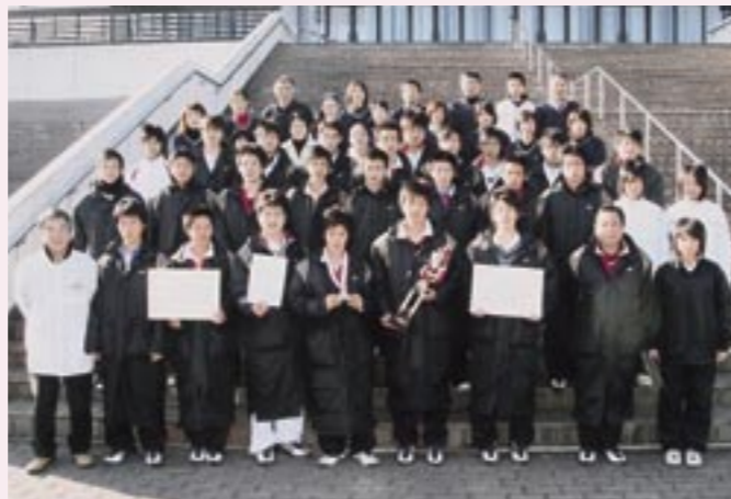
関東高校選抜ソフトテニス大会 3 位の成績を収めた全日本少年少女空手道選手権大会の出場を決めた岩瀬日大高校ソフトテニス部のみなさん

同校は、県予選を初戦から危なげなくストレート勝ちで優勝を決め、本大会の出場となりました。本大会では、1 回戦で拓殖大学第一高校（東京都）を 3-0、準々決勝で国学院大学（千葉県）に 2-0 で勝利。準決勝では、武蔵越生高校（埼玉県）に 1-2 で惜敗し決勝進出を逃しましたが、見事に第 3 位に入り、全国高校選抜ソフトテニスインドア大会の出場権を獲得しました。大会での同校の活躍が期待されます。