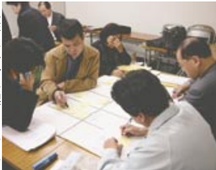
▶各班に分かれて景観づくりルールの論議が繰り広げられました。