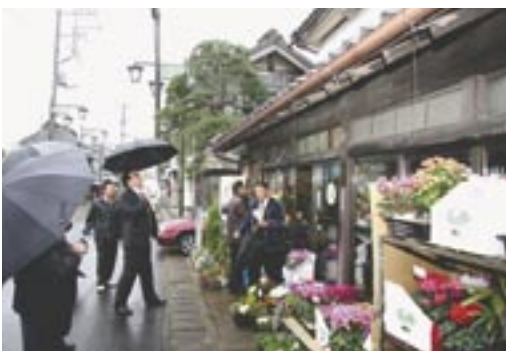
▶悪天候の中、近江八幡市の職員の方は真壁のまちなみなど熱心に本市を視察されました。

桜川市では、今後もこのような自治体間の交流を積極的に行ない、良いまちづくりにつなげていきたいと考えております。