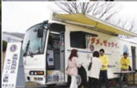
会場の一隅で行われた、常陸大和ライオンズクラブ主催の薬物乱用防止キャンペーン運動に、麻薬・覚せい剤乱用防止キャラバンカーがやってきました。

会場の廻りには、桜が咲き乱れ日本庭園さながらでした。ガーデンテーブルなどが来場者の目を引きました。