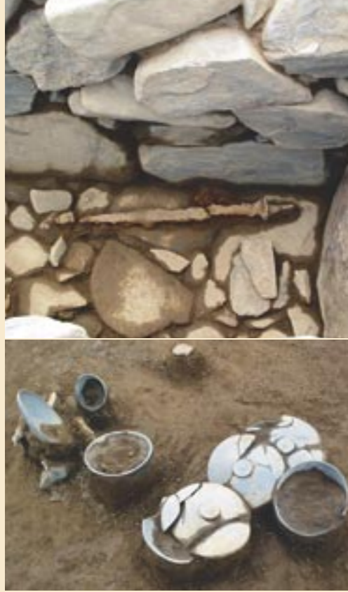
写真上：出土した鉄剣 写真下：お供え物としてささげられた土器

甕が作られた場所は不明ですが、窯で焼くだけでも大変そうなものを、尾根の上まで急斜面を登って持つてくることは、自動車などなく馬も貴重品だった当時、どれほどの苦勞だったことか想像してみてください。そして、それらを命令することができる力を