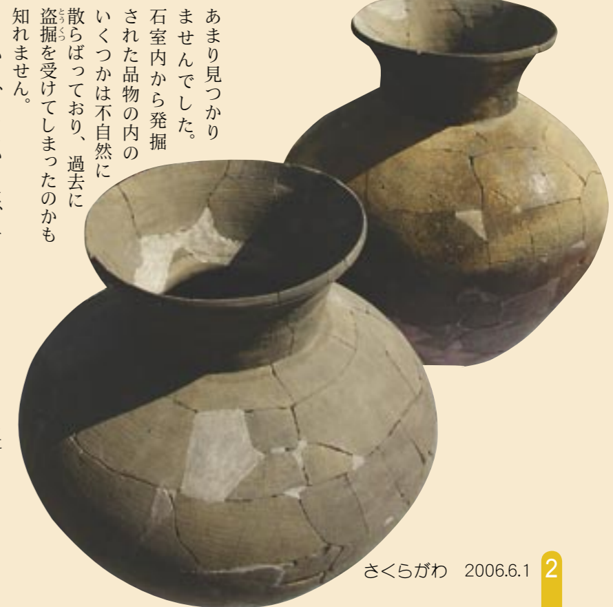
山ノ入古墳群の2号墳から出土した須恵器の甕（高さ：80～90cm / 幅：70～80cm）

(※) 須恵器は、丘陵の斜面をくりぬいてつくった「あな窯」のなかで高温で焼かれた硬い土器で、その技術は、5世紀ごろに朝鮮半島から日本に伝わったとされています。それまでの日本には、野焼きで焼いた縄文土器や弥生土器などの赤っぽい素焼きの土器しかありませんでした。