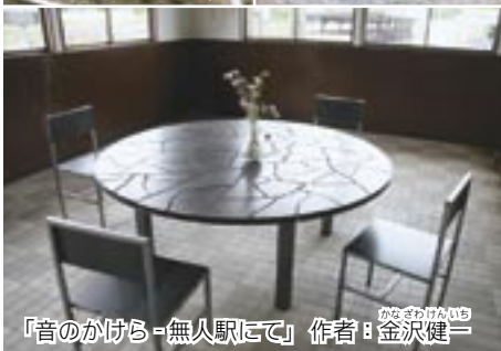
「音のかけら-無人駅にて」 作者：金沢健一