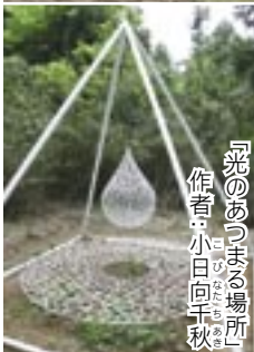
「光のあつまる場所」 作者：小日向千秋