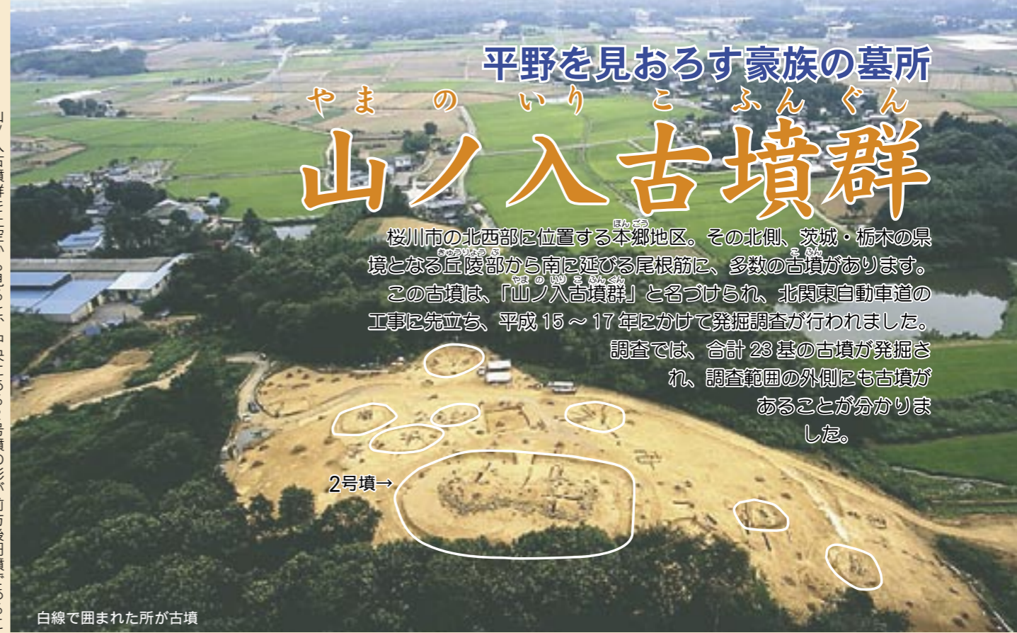
山ノ入古墳群を上空から見ると、中央にある2号墳の形が前方後円墳であることがよくわかります。

桜川市の北西部に位置する本郷地区。その北側、茨城・栃木の県境となる丘陵部から南に延びる尾根筋に、多数の古墳があります。この古墳は、「山ノ入古墳群」と名づけられ、北関東自動車道の工事に先立ち、平成15～17年にかけて発掘調査が行われました。調査では、合計23基の古墳が発掘され、調査範囲の外側にも古墳があることがわかりました。