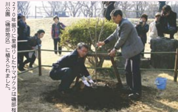
270 年振りに里帰りしたヤマザクラは磯部桜川公園（磯部地区）に植えられました。

江戸時代中期の徳川吉宗の時代、常陸国・桜川（現茨城県桜川市岩瀬地区）から現在の東京都小金井市などを流れる玉川上水沿いに移植されたヤマザクラの子孫が 270 年振りに里帰り、約八百本の桜がある磯部桜川公園（磯部地区）に記念植樹されました。