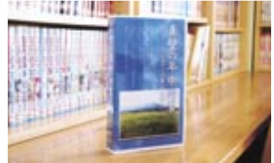
真壁の年中行事 ~ふるさとの祭礼と信仰~ (ビデオ) まかべふるさと創り実行委員会