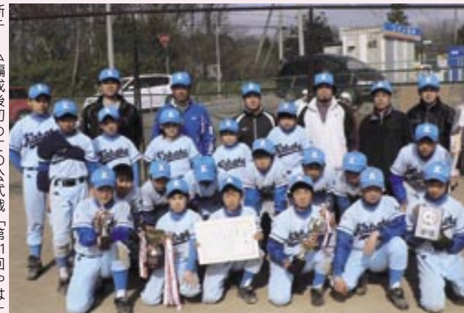
新チーム編成後初めての公式戦「第 11 回やはたカップ学童野球大会」で、準優勝した樺穂ブルージェイズのみなさん

県西地区の学童球児に春を告げるこの大会は、学童野球の技術向上と子ども達の健全育成を目的に行われ、5 年生を中心とした新チーム編成による初めての公式戦となります。大会には、地元下妻市をはじめ近隣市町から 16 チームが参加。同チームは、1 回戦から大差で勝ち上がり、決勝戦で宗道ニューモンキーズ（下妻市）と接戦の末に敗れましたが、子ども達は、「これから夏の県大会を目指して頑張ります。」と元気に述べていました。