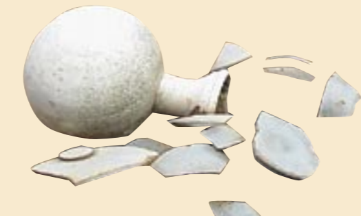
古墳へ至る道に置かれた土器

175-3111代表）と真壁庁舎（真壁町飯塚911 / ☎0296-5511111代表）、桜川市歴史民俗資料館（真壁町真壁571 / ☎0296-5510556）に展示してあります。