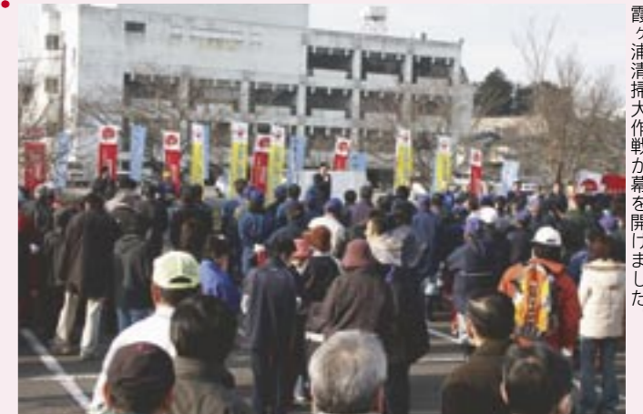
岩瀬中央公民館で盛大なセレモニーが行われ、霞ヶ浦清掃大作戦が幕を開けました。

これは、昭和 48 年夏、霞ヶ浦での養殖コイのへい死を契機に、霞ヶ浦・北浦流域の 38 市町村で実施されている「霞ヶ浦・北浦地域清掃大作戦」の一環として行われたもので、一斉清掃を実施することにより、霞ヶ浦流域住民の水質浄化意識の高揚を図ることを目的に実施されました。当日は、朝 7 時 30 分から市関係者をはじめ 11 自治体・37 団体の合計 800 人が参加。約 2 時間かけて清掃作業が行われ、約 1 トン（軽トラック約 5 台分）のゴミが参加者の手によって回収されました。