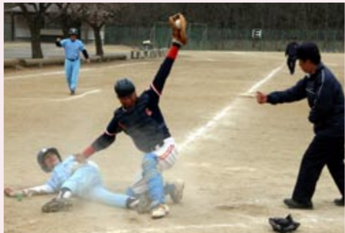
参加 41 チーム・770 人の選手が、高齢者とは思えないハッスルプレーで熱戦を繰り広げました。

真壁運動場と桃山中学校グラウンドを会場に、「第 12 回近県親善シニアソフトボール大会」が開催されました。本市からは、真壁シニアソフトボールクラブと大和シニア、真壁シニアOBクラブの 3 チームが参加。真壁シニアソフトボールクラブが第 3 位の好成績を収めました。この大会は、同チームが合併後再編成された新チームのスタートで、来年、桜川市を会場に開催される「ねんりんピック茨城 2007」ソフトボールに向けてのチームづくりを占う大会に位置づけられていました。大会には、県内はもとより近県 6 都県から、シニアの部・グラウンドシニアの部の計 41 チーム・770 人が参加。攻守にわたるハッスルプレーで熱戦が繰り広げられました。