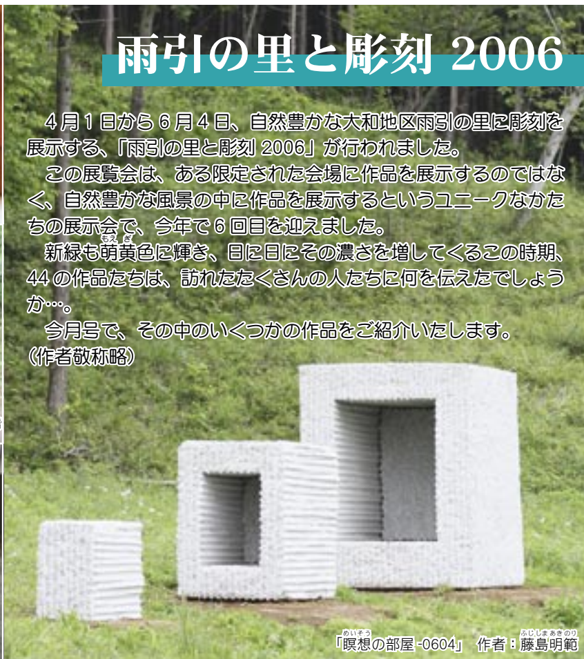
「瞑想の部屋-0604」 作者：藤島明範