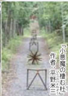
「小悪魔の棲む杜」 作者：平野米三