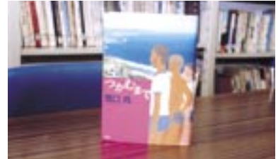
空をつかむまで 関口 尚