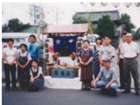
真壁町仲町の薬師さま(万灯会)

本ビデオは、その行事を後世に伝え、受け継いでいくための記録として制作されたものです。歴史民俗資料館のほか、各公民館の図書室にも用意してありますので、ぜひご覧ください。