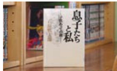
息子たちと私 石原慎太郎