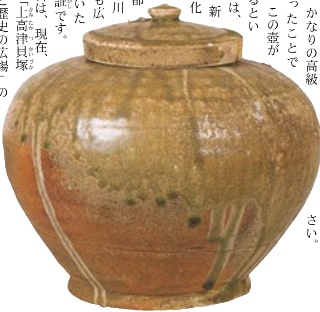
灰釉陶器蓋付短頸壺 桜川市大國玉出土(個人蔵) 高さ:約22cm 直径:約20cm