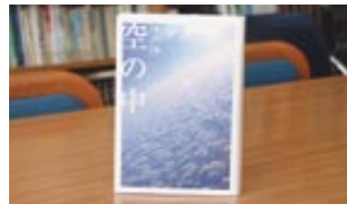
空の中 有川 浩