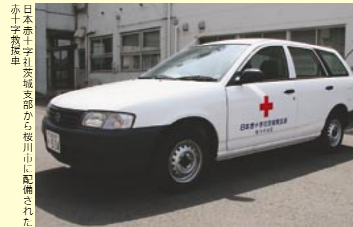
日本赤十字社茨城支部から桜川市に配備された赤十字救急車