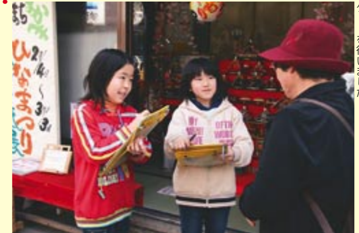
真壁小学校児童が、観光客のみなさんとふれあおうと、ひなまつり期間中の街に飛び出しアンケートを行いました。

真壁小学校3年生が、真壁のひなまつり期間中に観光客のみなさんにアンケートを行いました。児童たちが、地元へ何かできることをしようと総合的学習の時間を利用して始まったもので、アンケートの内容も自分たちで考えました。また、おひな様が飾られている家の人にも話を聞くなどをして、今後、ひなまつりマップを作成する予定だそうです。アンケートに答えてくれた観光客の人がすごく優しくかったです。折りびなのプレゼントを渡したら、とても喜ばれました。いろんなところから来た人にアンケートをとり、仲良くなれました。」と児童たちは話していました。