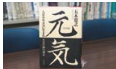
元気 人はみんな元気に 生まれ元気の世界へ還る 五木寛之