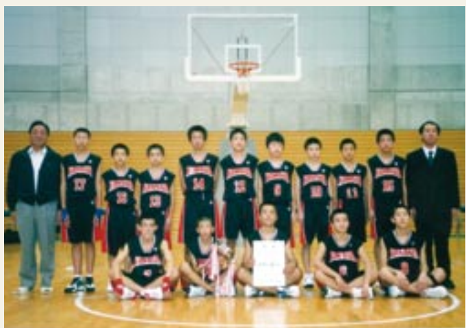
茨城県中学校新人体育大会バスケットボールで優勝した大和中学校男子バスケットボール部のみなさん

部員のみなさんは、「目標は、茨城県中学校総合体育大会に優勝して全国大会に出場することです。」と力強く述べていました。今後の活躍が期待されます。