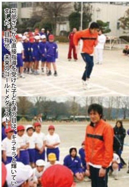
苜部さんから直接指導を受けた子ども達の目は、キラキラと輝いていました。目指せ、未来のワールドメタリスト!!

昭和35年に茨城県庁に入庁し、県企画部参事、同土木部次長、同出納事務局長、県西地方総合事務所長などを歴任。34年間にわたり地方自治一筋に奉職され今回の栄えある受章となりました。同氏は、「今回の受章は、職場において上司や同僚、後輩に恵まれたおかげと感謝しております。また、妻の内助の功と健康で明るい家庭に恵まれたので仕事に専念できました。」と喜びを語っていました。