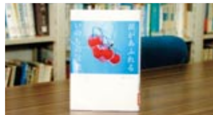
涙があふれるいのちの言葉 日高 あつ子