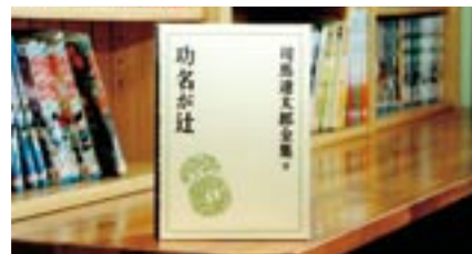
NHK大河ドラマ原作本「功名が辻」 司馬 遼太郎