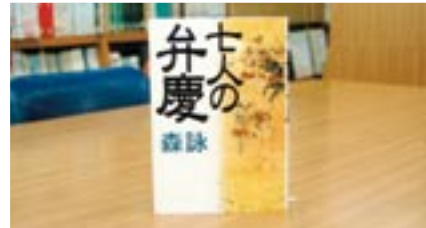
七人の弁慶 森 詠