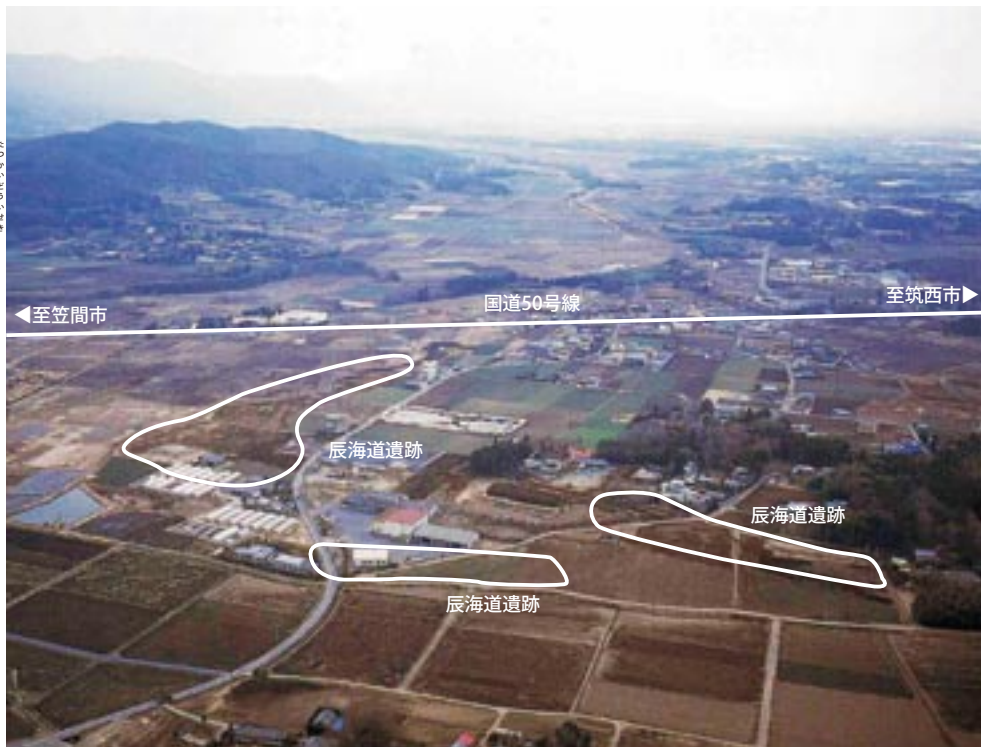
上空から見た「辰海道遺跡」