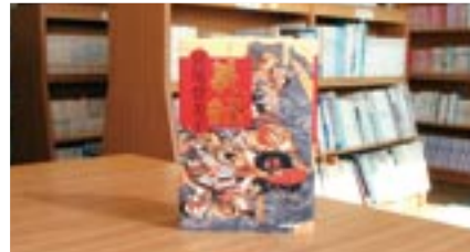
義経 宮尾 登美子