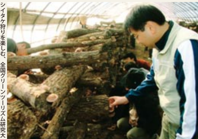
シイタク狩りを楽しむ、全国グリーン・ツーリズム研究大会inいばらきの参加者

「近くの田舎をさがしてみよう！」をキャッチフレーズに、茨城県と全国グリーン・ツーリズム研究大会inいばらき実行委員会が主催する、「全国グリーン・ツーリズム研究大会inいばらき」が、真壁地区で開催されました。これは、つくば駅（つくばエクスプレス）を発着地とする1泊2日の体験ツアーで、実りの秋の茨城県で、見て、触れて、食べて、いばらきならではの体験を楽しんでもらおうと企画されたもので、首都圏からの22人の参加者は、町並み散策、藍染め・釜戸炊き体験、シイタク・みかん狩りなど通じて秋の2日間を満喫したようでした。