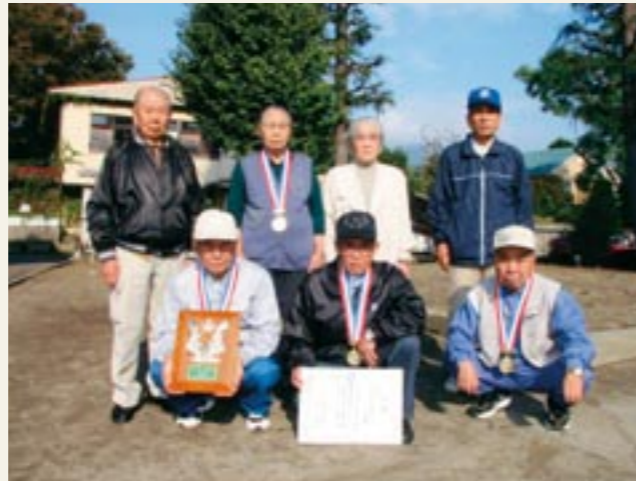
茨城県健康福祉祭わくわくスポーツ中央大会の輪投げの部で通算3度目の優勝を飾った、真壁鍋屋チームのみなさん

大洗町総合運動公園で開催された、「第10回茨城県健康福祉祭わくわくスポーツ中央大会」の輪投げの部で、真壁鍋屋チームが3度目の優勝を果たしました。この大会は、高齢者に適したスポーツを通じて健康の保持増進を図るとともに地域間の交流を深め、明るく活力ある長寿社会の推進を目的に開催されるもので、当日は、県内各地区を勝ち抜いた16チームの間で競技が行われました。同チームは、予選リーグを2勝1敗の成績で決勝トーナメントに駒を進め、見事通算3度目の優勝を飾りました。