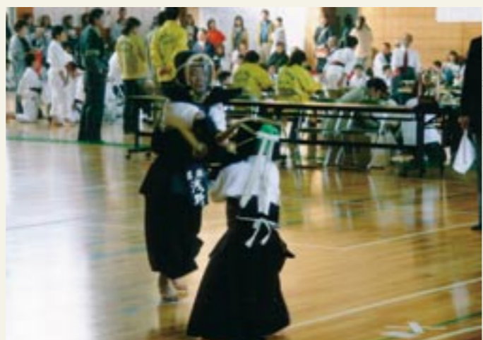
競技が開始されると、ちびっ子武術道家の気合いの入った声が会場に響き渡りました。

桜川市真壁第1体育館と農業者トレーニングセンターを会場に、「桜川市まかべ武術道大会」が開催されました。この大会は、桜川市近隣市町村のスポーツ少年団が集い、競技を通じて相互に親睦を深め、心身ともに健全な青少年育成を図ることを目的に開催されるものです。当日は、近隣3市から29のスポーツ少年団の少年武術道家約600人が参加。応援に駆けつけた父母からの声援の中、日頃鍛えた技を存分に発揮し熱戦が繰り広げられました。