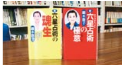
新 六星占術の魂生・極意 細木 数子