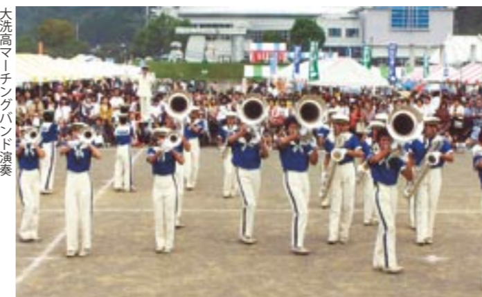
大洗高マーチングバンド演奏