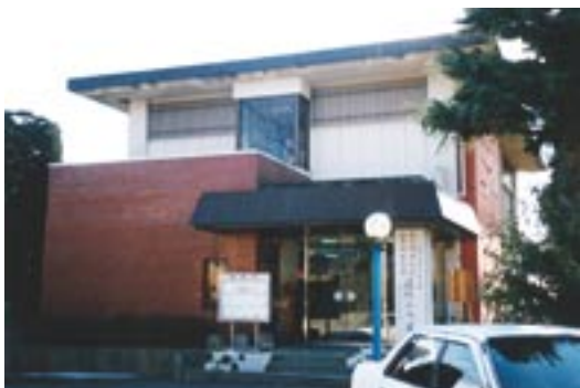
真壁中央公民館東側の一面にある桜川市歴史民俗資料館