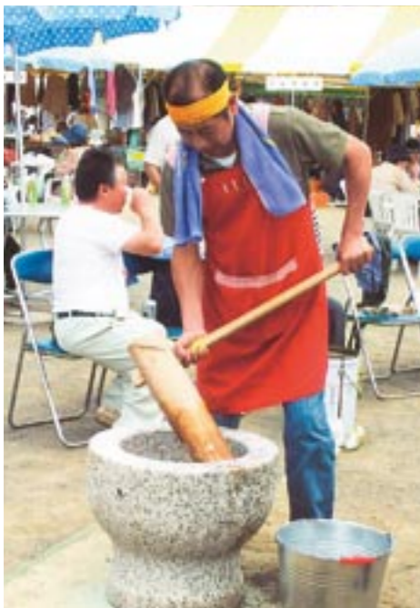
おいし「も」を「き」きました