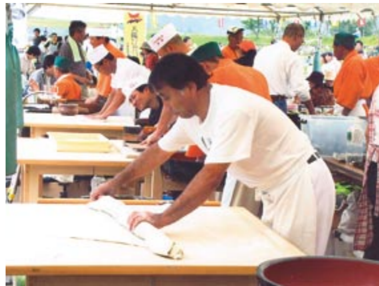
日本「おいし」常陸秋そば