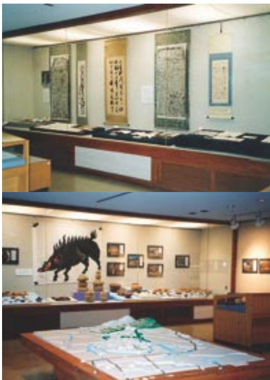
桜川市歴史民俗資料館の展示室(二階)の様