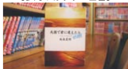
天国で君に逢えたら 飯島夏樹