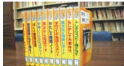
だいきミステリー 全10巻