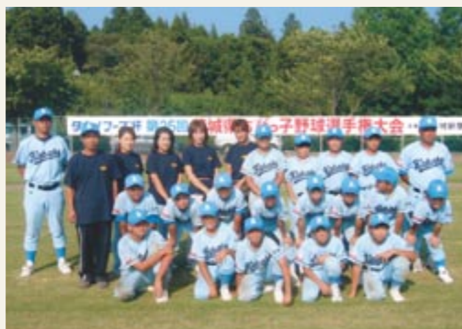
茨城県ちびっこ野球選手権大会でベスト8入りを果たした、樺穂ブルージェイズのみなさん

那珂市の那珂総合公園野球場と多目的広場軟式野球場をメイン会場に、「タカノフーズ杯第25回茨城県ちびっこ野球選手権大会」に、本市から岩瀬キングタイガー（岩瀬地区）と樺穂ブルージェイズ（真壁地区）が参加しました。大会には、開催地代表2チームと県内4地区からの代表46チームの計48チームが参加して、3日間にわたり熱戦が繰りひろげられました。結果、樺穂ブルージェイズがベスト8入りを果たしました。これからの両チームの活躍が期待されます。