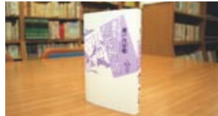
すらすら読める 源氏物語 上巻 瀬戸内寂聴