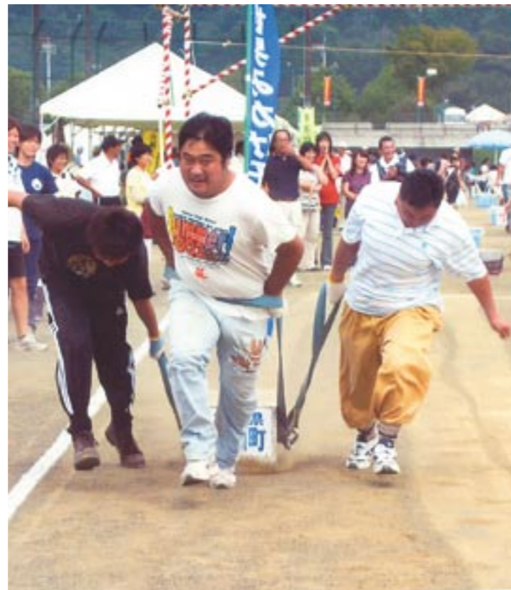
豪快に220kgのみかげ石を引く選手のみなさん