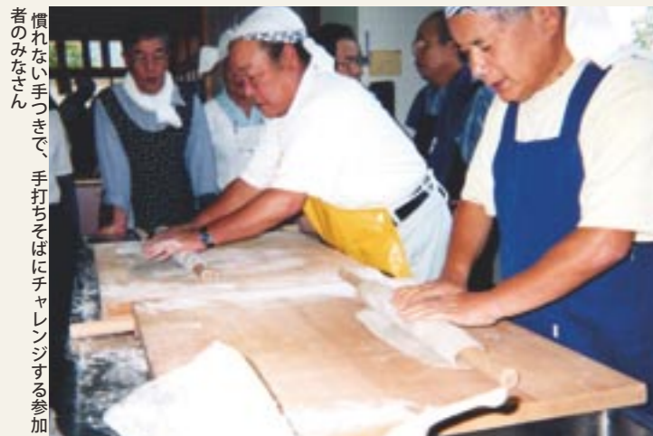
慣れない手つきで、手打ちそばにチャレンジする参加者のみなさん

真壁福祉センター調理室において、「男のクッキング教室」が開催されました。これは、「手打ちそばを作ってみませんか。」と、桜川市食生活改善推進員協議会真壁支部の呼びかけにより行われたもので、当日は38名の男性が参加。参加者は、講師から食生活と健康についての話を聞いたり、慣れない手つきで地粉を使った手打ちそば・そばがき、天ぷら・麺つゆ等を作って、一生懸命実習にチャレンジしました。どのテーブルでも、力をあわせて麺を打っている姿がとても印象的でした。参加者からは、「みんなと一緒にできてとても楽しかった。」「回数をふやして欲しい。」などの声が聞かれました。