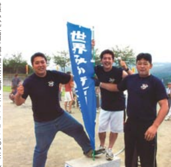
世界みかげ石引き選手権大会に優勝したAKATUKAのみなさん