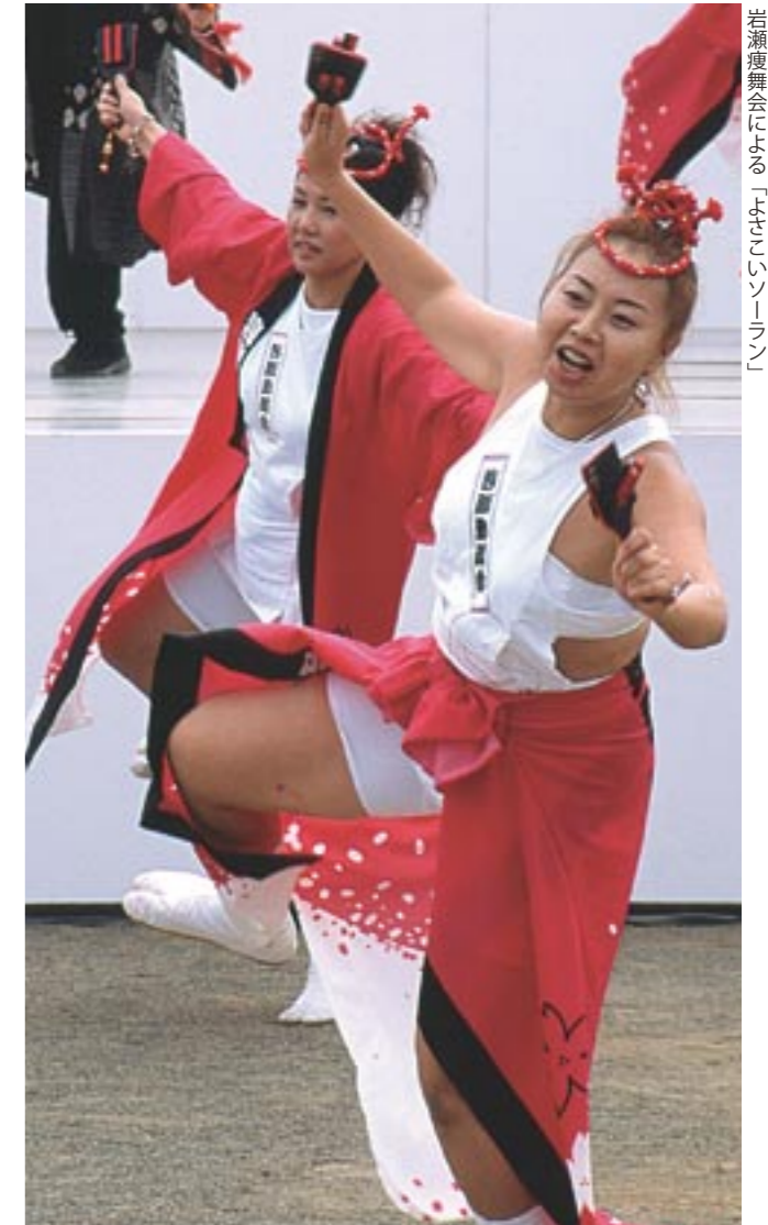
岩瀬舞会による「ゆきこいソーラン」

第19回岩瀬町民祭が9月22日から9月26日にかけて岩瀬総合運動公園を主会場に開催されました。メインデーの9月23日は、岩瀬西中マーチングバンドと岩瀬東中プラスバンドが出演したセレモニーを合図に「健康まつり」「商工祭」「いわせそばまつり」などが開かれ、青空のもと延べ8千人を超える人々が訪れました。