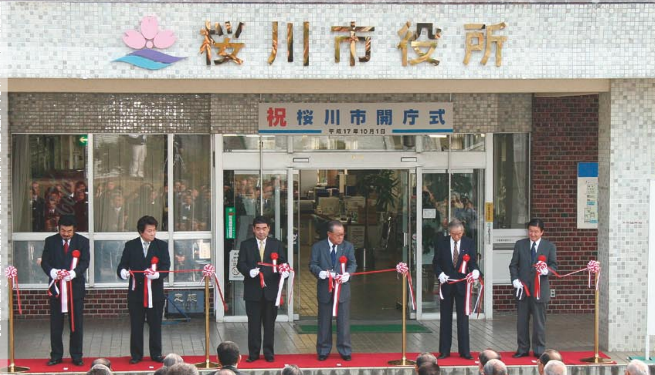
桜川市開庁式でテープカットする。(左から) 中田裕 旧岩瀬町長・平間小四郎 旧眞壁町長・飯島輝信 (旧大和村長) 桜川市長職務執行者・橋本位知朗 旧岩瀬町議会議長・小林正紀 旧眞壁町議会議長・鈴木好史 旧大和村議会議長