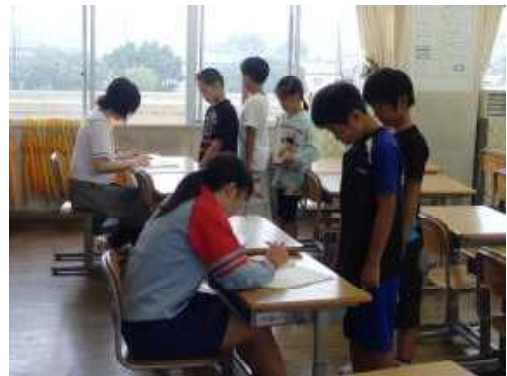
【中・高校生サポーターに丸付けをしてもらう子供達】

多くの中学生、高校生の協力を得ることで、児童一人一人に応じたきめ細やかな支援が可能になり、実施後の評価テストの結果からも児童の計算力が向上したことが明らかになりました。