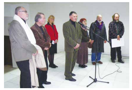
浅賀さんの工房で作品制作をしたブルガリアを代表する芸術家たち

石文化の役割は大きく、人々の平和と人生に直結することもあります。石の本場、桜川市はすでに日本一の石材産地として知名度、実績、人材、技術、経験、歴史などが蓄積されています。これらを生かして、世界の人々の平和や暮らしに役立てる工夫こそ、桜川ホストタウン事業であると考えます。コロナ禍の時代にこそ、新しい発想とやわらかい心のネットワークが国際交流に広がるとうとしていくのではないのでしょうか。 この事業に関心を寄せてくださる皆さまに更なる報恩の挑戦をすることを誓います。