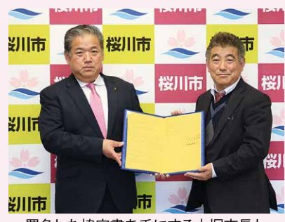
署名した協定書を手にする大塚市長と東海林代表取締役（右）