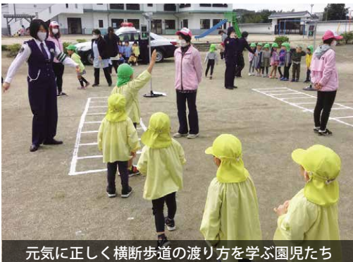
元気に正しく横断歩道の渡り方を学ぶ園児たち

参加した園児たちは、横断歩道の正しい渡り方や飛び出しの危険性を学びました。そのほか歩行実技やパトカー見学、乗車体験などをし、最後は、警察官と一緒に記念撮影を行いました。