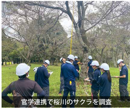
官学連携で桜川のサクラを調査

今年度は新たに約100本の樹木を樹木医の指導のもと、樹高、幹の太さのほか、枯れ枝、病気、腐朽などについて1本ずつ丁寧な調査が行われました。