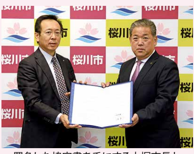
署名した協定書を手にする大塚市長と小室支社長（左）