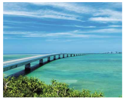
伊良部大橋(宮古島市)