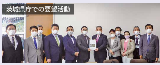
茨城県庁での要望活動