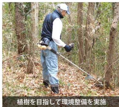
植樹を目指して環境整備を実施

同会は、歴史遺産である竜ヶ井城に注目した方々の「竜ヶ井城を多くの人に知ってもらい、自然観察、歴史探訪、登山などを通して、地域活性化に協力したい」という思いのもと、平成30年2月に設立した会であり、竜ヶ井城周辺の下刈りなどの活動を行っています。