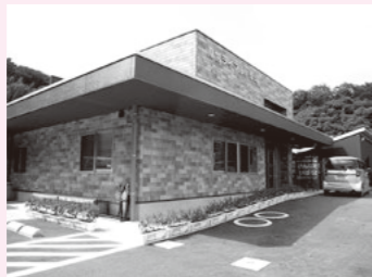
県営ライフル射撃場 (真壁町桜井地区)

茨城国体の開催に関しては、選手をはじめ全国からたくさんの方が訪れるため、期間中は市内の旅館や小売店を利用いただき、市全体で活気のある国体になるよう、積極的なPR活動すること。