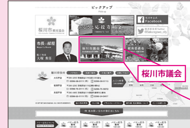
①「桜川市議会」をクリック