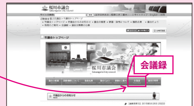
②「会議録」をクリック→会議録画面が見られます