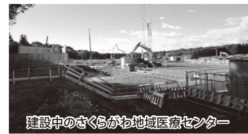
建設中のさくらがわ地域医療センター

問 県西総合病院組合の持つ負債は、固定資産税・企業債・建物の起債未償還分が3億1900万円、リース債務（医療機器等）で8300万円、合わせて4・2億円あります。これをどのように解決するかという問題です。今まで、県西病院の補助は、桜川市8、筑西市2の割