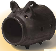
げんぼうじやき 源法寺焼の蚊やり豚