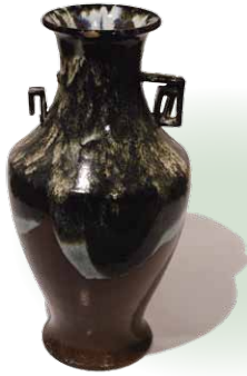
しざんやき 紫山焼