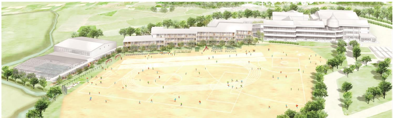
※上の図は、左からプール、体育館、新校舎、既存校舎（現桃山中学校）の全体のイメージ図です。

応募してくださったみなさまに、審査委員を代表して深く感謝申し上げます。ありがとうございました。