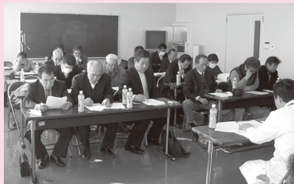
喜子名 秀悦 20 委員長 塚 大林 委員長 委員 委