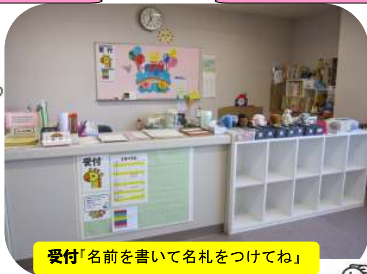
受付「名前を書いて名札をつけてね」