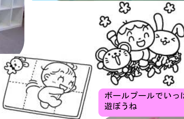
ボールプールでいっぱい遊ぼうね