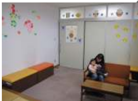
授乳・相談コーナー