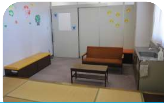
授乳、おむつ交換室（プライバシーが守られます）