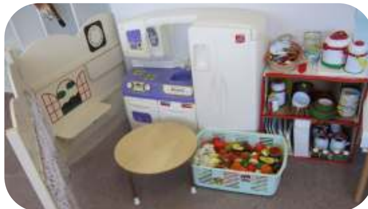
おまごごとコーナー（おやさいやお肉を切ってお料理をしましょう）