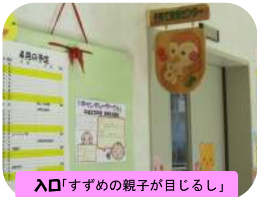
入口「すずめの親子が目じるし」