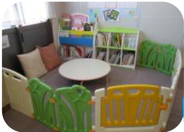
絵本コーナー「毎月、新しい本が加わります。貸し出しもしています」