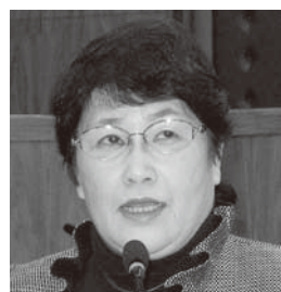
市村 香 議員