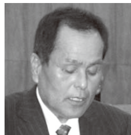
仁平 実 議員