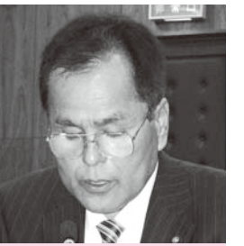
仁平 実 議員