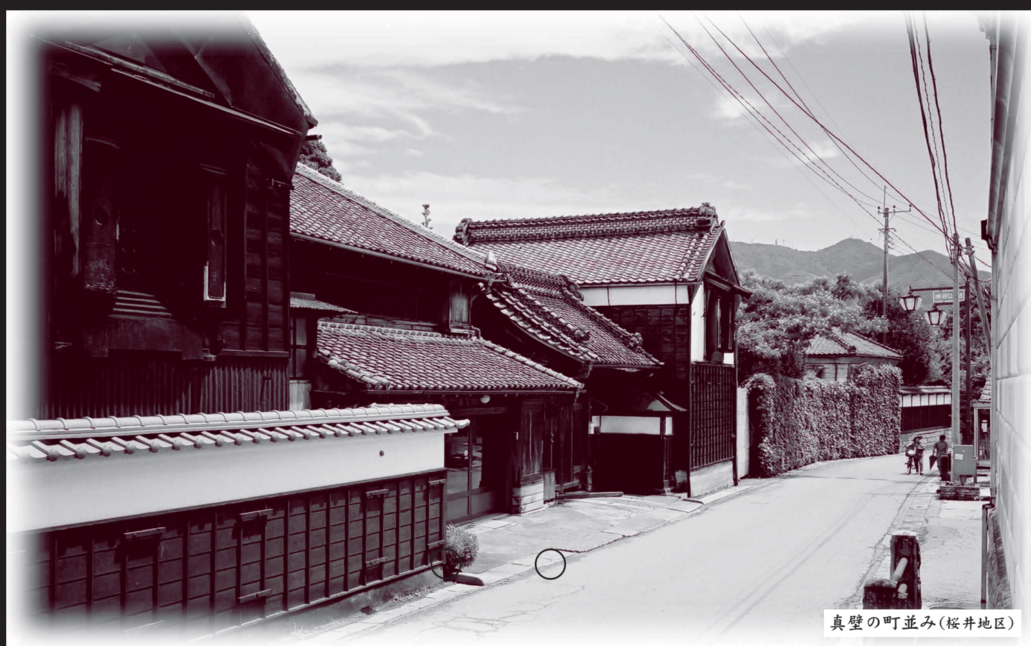
真壁の町並み(桜井地区)