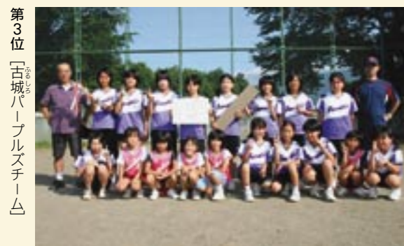
第3位「古城パールズチーム」