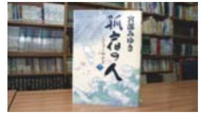
孤宿の人 宮部みゆき