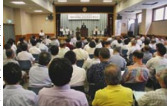
130人が参集して行われた桜川市真壁町伝統的建造物群保存対策調査「真壁の町並み」報告会の模様