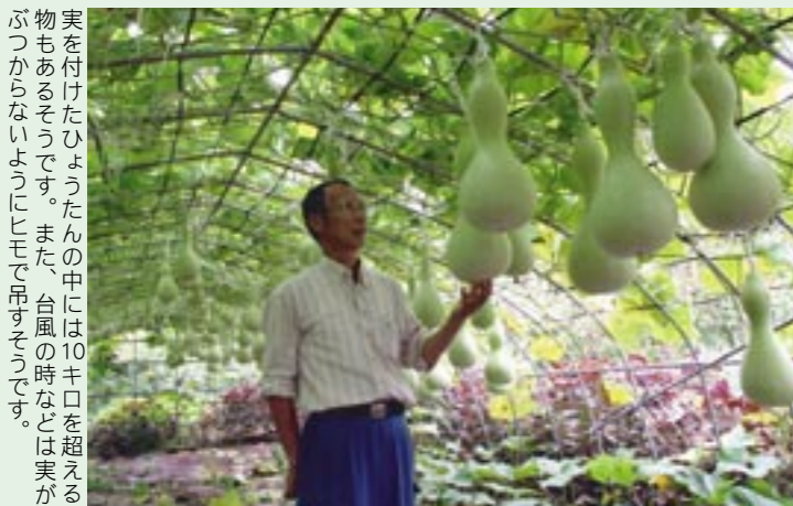
実を付けたひょうたんの中には10キロを超えるものもあるそうです。また、台風の時などは実がぶつからないようにネットで抑えます。