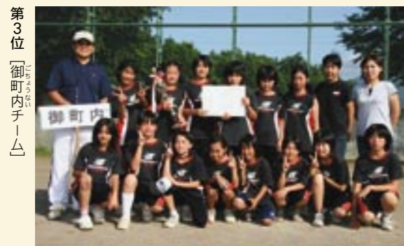
第3位「御町内チーム」