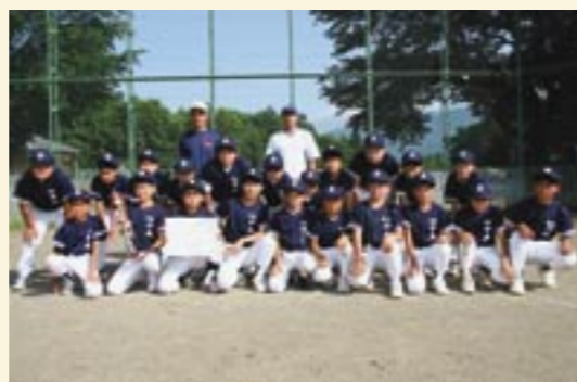
第3位「羽黒中央チーム」