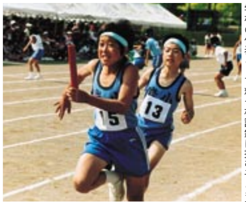
学校の代表として精一杯記録に挑む子ども達