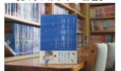
子どもにつたえる日本国憲法 井上ひさし・いわさきちひろ