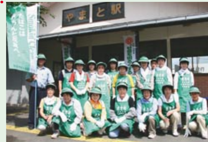
吸い殻の落ちていないきれいな街を願ってJRやまと駅周辺のクリーン作戦を実施した、真壁・大和たばこ小売組合女性部のみなさん

きれいに見えても、よく見るとたくさんの吸い殻が捨てられています。たばこやゴミのポイ捨ては止めて、みんなできれいな街を守っていきましょう。また、たばこは喫煙場所で吸うか携帯灰皿などを持ち歩くようにしましょう。