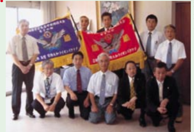
岩瀬・真壁・常陸大和ライオンズクラブ役員の方から、石川教育長(写真:左から2番目)と櫻川市子ども会育成連合会会長(写真:左側)に優勝旗2旗が手渡されました。

この大会は、桜川市として初めての大会となるもので、子ども達がスポーツを通じて健康で明るい心身の育成と地区子ども会の友好親善を目的に開催されました。「今回は、青少年健全育成の事業の一環として行ったもので、子ども達がスポーツを通じて心身共にすくすくと成長してくれることを願っています。」とライオンズクラブのみなさん。