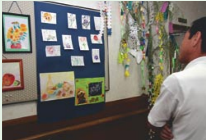
様々な活動をおして社会参加を目指す「スマイルの会」のみなさんの絵てがみや水彩画などの力作が岩瀬福祉センターに展示されました。

スマイルの会は、家に閉じこもりがちの人や、人との付き合いがうまく出来ない人たちが集まって活動している団体で、精神ボランティアのみなさんの協力によって毎週火曜日に岩瀬福祉センターで、創作活動や環境美化運動・畑作業でさつまいも作り・調理実習およびスポーツなどを行って社会参加をめざしています。同会の問い合わせは、健康推進課・予防係(☎0296-75-2486)までお願いいたします。