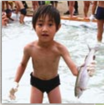
ニジマスをとったどー！