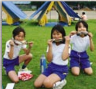
テントでの宿泊も楽しい夏休みの思い出

谷貝・紫尾小学校の両校で、地区コミュニティスクールが行われました。 これは、子ども達の「生きる力」を育むためには豊かな体験が不可欠であることから、地域と学校が一体となり多彩な地域活動の場と体験機会を年間通して提供する取り組みです。 今回、両校のコミュニティスクールには児童・保護者・関係団体約350人が参加。子ども達は、自分の手で宿泊用テントの設置をしたり、ニジマス・アユの掴み取りやバーベキュー、レクリエーションなどで楽しい時間を過ごしました。