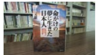
命がけの夢に生きた日本人 世界の国々に刻まれた歴史の真実 黄 文雄