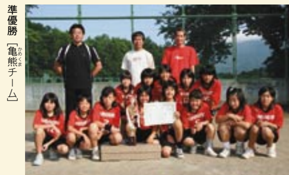
準優勝「亀熊チーム」